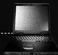
MAXDATA Pro 700T