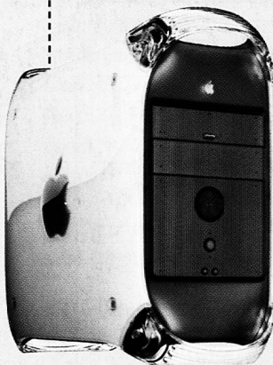
Power Macintosh G4