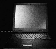
MAXDATA Pro 700T