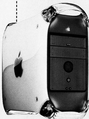
Power Macintosh G4