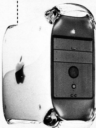
Power Macintosh G4