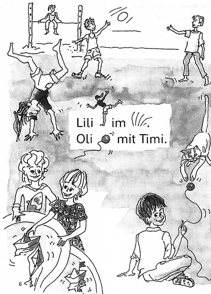
Beispiel einer ausgewogenen und vielfältigen Darstellung. Auch Mädchen sind körperlich aktiv und nehmen Raum ein. Das Buchstabenschloss.