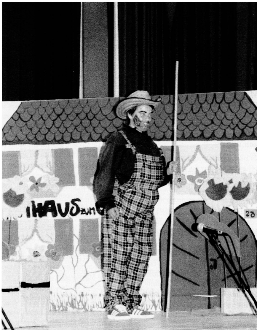
Der Schweinehirt von Schilda

Umfeldbezogen führen: Die Standesregeln wie das Berufsleitbild gehen vom Kontext der ganzen Schule als Bezugsrahmen aus. Das ist wichtig, denn das gesellschaftliche Umfeld hat Einfluss auf die einzelnen Personen. Die Diskussion z.B. zur Gewalt an Schulen hat es gezeigt. Sind wir auf dem Weg zu einer gerechteren Schule? Bemühen wir uns um den Dialog über die Klassengrenzen hinweg? Haben wir gemeinsame pädagogische Aufgaben angepackt?