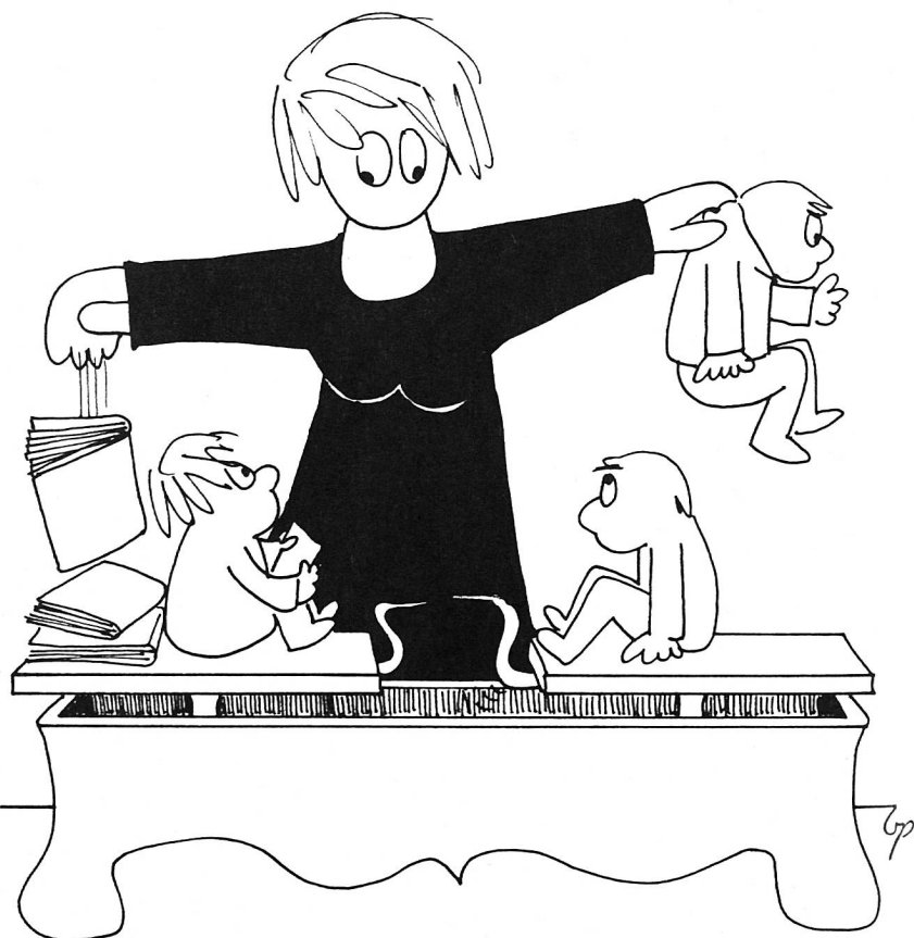
Die Lehrperson sorgt für eine ausgewogene Förderung.

Das LCH-Berufsleitbild zielt im Wissen um die vielseitigen und hohen Ansprüche an die Lehrpersonen auf die professionell Lösung der Schwierigkeiten, auf die Überwindung der Härte des Unterrichtens und der täglichen