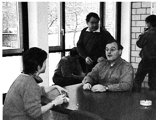
SPAR gibt Anlass zu Diskussionen.

Wir sind noch auf dem Weg, aber der festen Überzeugung, dass eine mittelgrosse Schule ihren Dienst an der Allgemeinheit deutlich verbessern kann, wenn sie ihr «Schicksal», wenigstens teilweise, in die eigene Hand nimmt. Die Lehrer haben zwar mehr Arbeit und grössere, auch finanzielle, Verantwortung. Im Gegenzug können sie aber die Entwicklung der Schule, in den kommenden