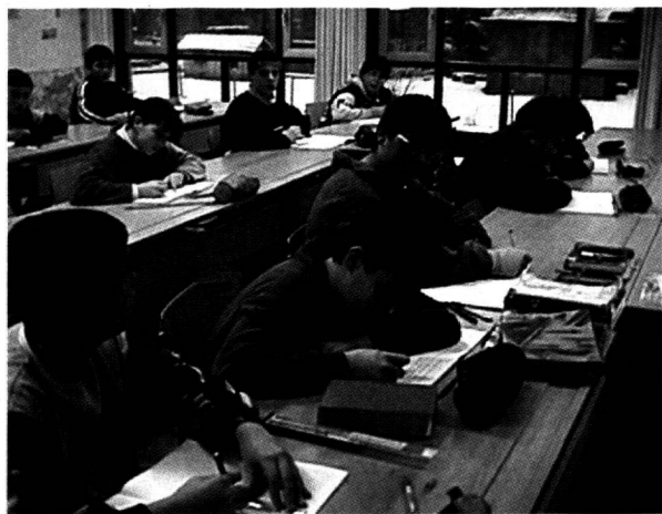
Gutes Lernklima in Roveredo.

Wir sind darauf bedacht, die Qualität unserer Schule laufend zu verbessern. Dazu haben wir ein internes «Besuchsprogramm» erarbeitet. Dies dient dazu, durch konstruktive Kritik unsere Arbeitsweise zu überprüfen, zu verbessern und weiterzuentwickeln. Wir be-