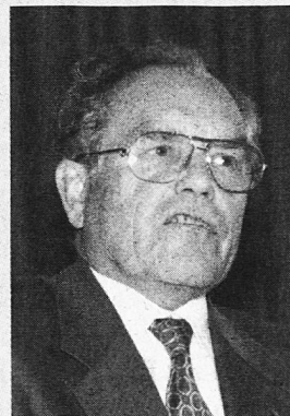
Regierungsrat J. Caluori

Aufgrund kantonaler Sparmassnahmen wird die Ansprache von Regierungsrat J. Caluori leider nicht im Schulblatt abgedruckt.