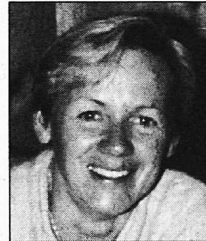
VON SILVIA PFEIFFER