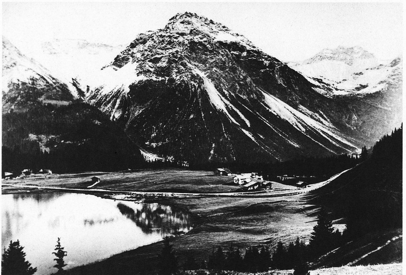
1890 am Obersee. Der Bahnhof steht heute auf dem Churer Alboden unterhalb des Zaunes. Der untere Zaun ist Grenze zwischen Churer Alp und Aroser Allmende. Die Schanfiggerstrasse ist fertiggestellt.