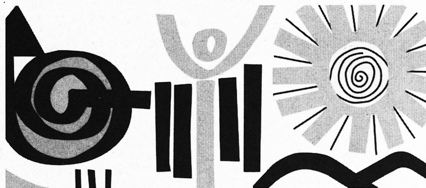
Schweizerische Lehrerinnen- und Lehrerbildungskurse Bodensee 10.-28. Juli 1995.

Das Erziehungs-, Kultur- und Umweltschutzdepartement hat diese Vorschläge akzeptiert und sie als neue Regelung mittels Departementsverfügung ab 1. Januar 1995 in Kraft gesetzt.