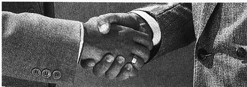
Gemeinsam in die Zukunft.

inskünftig bei gleicher Lektionenzahl dieselben Fächer besuchen soll. Etwa zur Hälfte sind im Kanton Zürich gemeinsame Oberstufenzentren bereits realisiert worden. In der Vernehmlassung befindet sich die gegliederte Sekundarschule seit vergangenem Jahr und der gegründete Verein «Oberstufe 2000» hat die gemeinsame Arbeit von Real- und SekundarlehrerInnen und -lehrern zum Ziel. Die diesbezügliche Zusammenarbeit bezeichnete der Vertreter aus dem Kanton Zürich als intensiv und man hofft, dass die bisherige Dreiteilung der Oberstufe zu einer gemeinsamen «Sekundarschule» mit einem «Sekundarlehrer» umgewandelt werden kann. Nicht viel verändert hat sich im Kanton Thurgau. Zwar sind in den vergangenen Jahren zahlreiche Oberstufengemeinden gegründet worden, und Kanton und Regierung haben Subventionen für den Bau von Oberstufenzentren und Beiträge für die verstärkte Zusammenarbeit auf der Oberstufe gesprochen. Die Formen der kooperativen Zusammenarbeit sind jedoch noch offen und der getrennte Lehrplan, der inhaltlich zwar zu rund 80 Prozent identisch und die ungleichen Arbeitsbedingungen und Lohnverhältnisse sind nicht unbedingt förderlich.