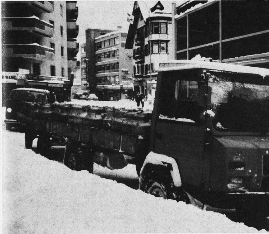
Landwirtschaft und Tourismus.