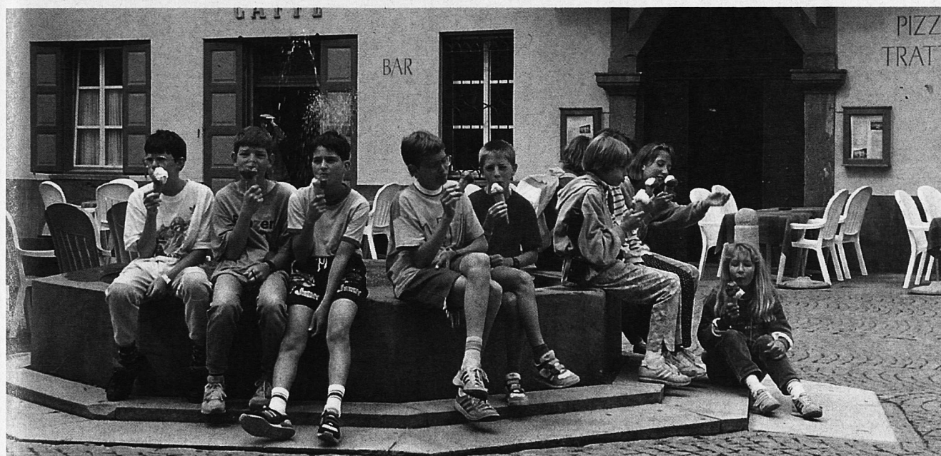
Eisgekühlt an die nächste Aufgabenstellung...

Klären Sie ab, ob Ihre Schulgemeinde für Lager und Lagerunfälle versichert ist. Wenn dem nicht so ist, bietet Pro Juventute eine spezielle kollektive Unfall- und/oder Haftpflichtversicherung für Lager an. Für eine Woche liegen die Kosten für die kombinierte Unfall- und Haftpflichtversicherung bei Fr. 4.30 pro Person für Sommerveranstaltungen und Fr. 22.30 für Winterveranstaltungen. Anmeldung und Information: Pro Juventute, Fachdepartement Versicherungen, Postfach, 8022 Zürich, Tel. 01/251 72 44.