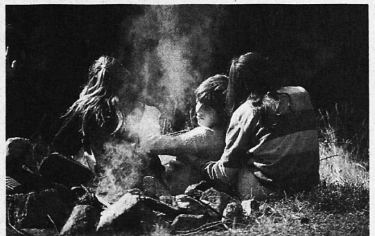
Riechen Sie auch schon die Lagerfeuerromantik?