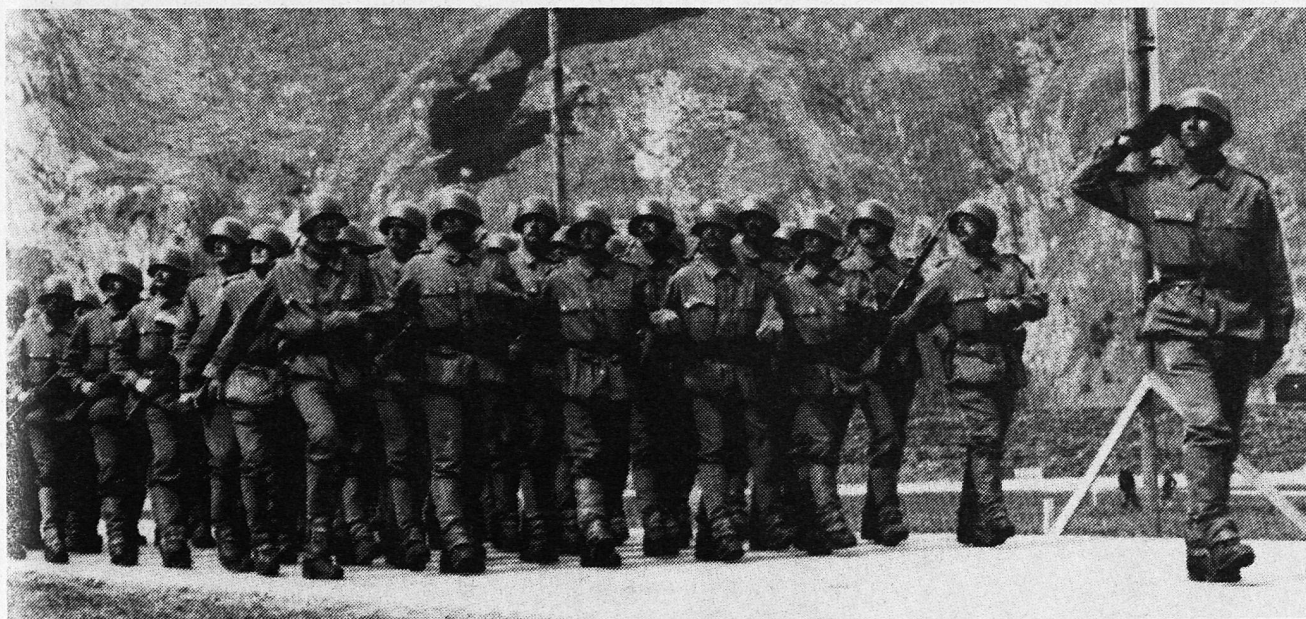
Die gegenwärtigen Aufgaben erfordern nicht einen Führer im alten Sinne.

Viele gut funktionierende Lehrerteams beweisen, «dass auch ein Lehrerteam machbar ist», sagte Sonderegger. Voraussetzung sei allerdings ein Klima des Vertrauens und des gegenseitigen Annehmens verschiedener Wertvorstellungen und pädagogischer Überzeugungen. Zentrales Anliegen des Schulleiters müsse die Förderung von Kooperation, Kommuni-