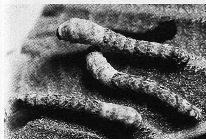
Seidenraupe aus der Diaserie «Seide»

36 Dias. Auf diesen prächtigen Dias wird die Seidenraupenzucht veranschaulicht.