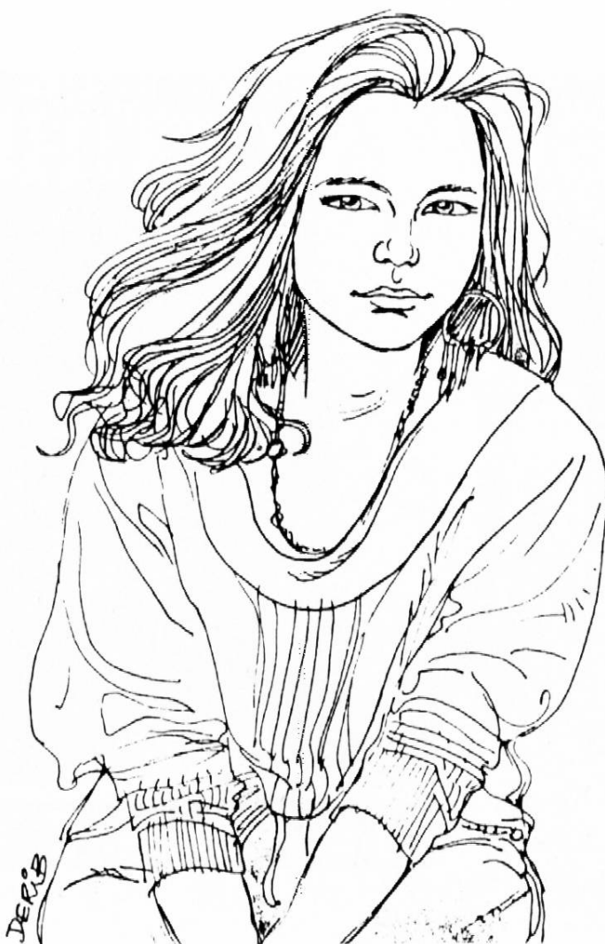
Jo – die Titelfigur aus dem gleichnamigen Comic von Derib.