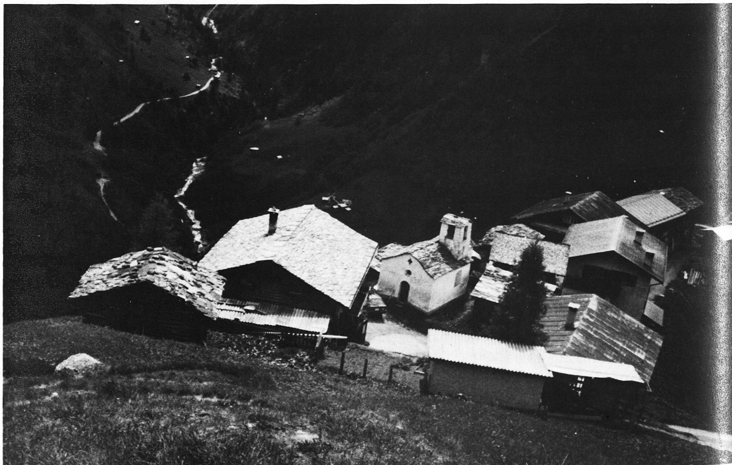
Auf den Spuren der Walser – unsere erste Leserreise

Am Samstag, den 20. Juni, treffen sich die Teilnehmer,-innen um 13.30 Uhr in Ilanz. Mit dem Postauto fahren wir nach St. Mar-