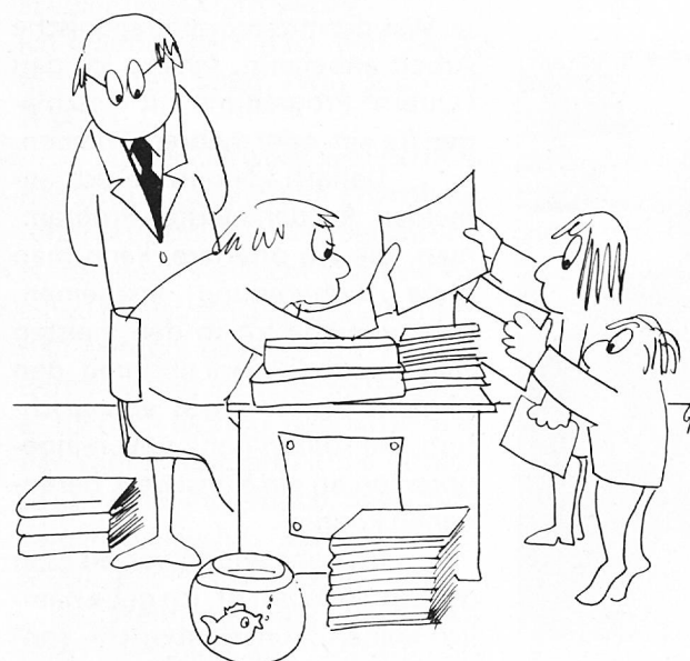
Angst – ein schlechter Ratgeber