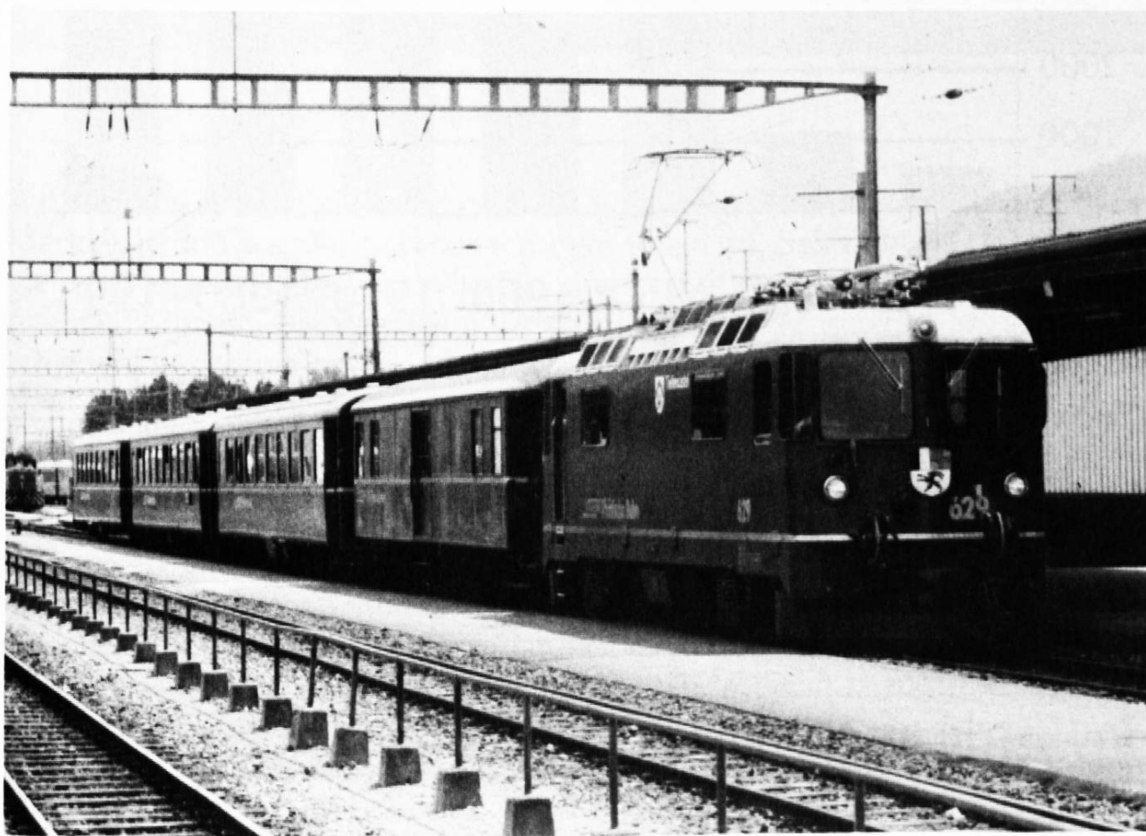
Die RhB, ein wichtiger Arbeitgeber für die ganze Region und zugleich der Grundstein für die Fraktion Landquart.

Gastwirte, Schmiede und Wagner verdienten glänzend und bauten weitere Häuser. Die grosse Entwicklung setzte aber erst 1889 ein, als die erste Etappe der Schmalspurbahn Landquart – Klosters – Davos fertiggestellt wurde. 1896 konnte das Teilstück Landquart – Chur in Betrieb genommen werden. Nach der Fusion mit der Centralbahn Chur – Thusis – Filisur nannte sich das Unternehmen «Rhätische Bahn».