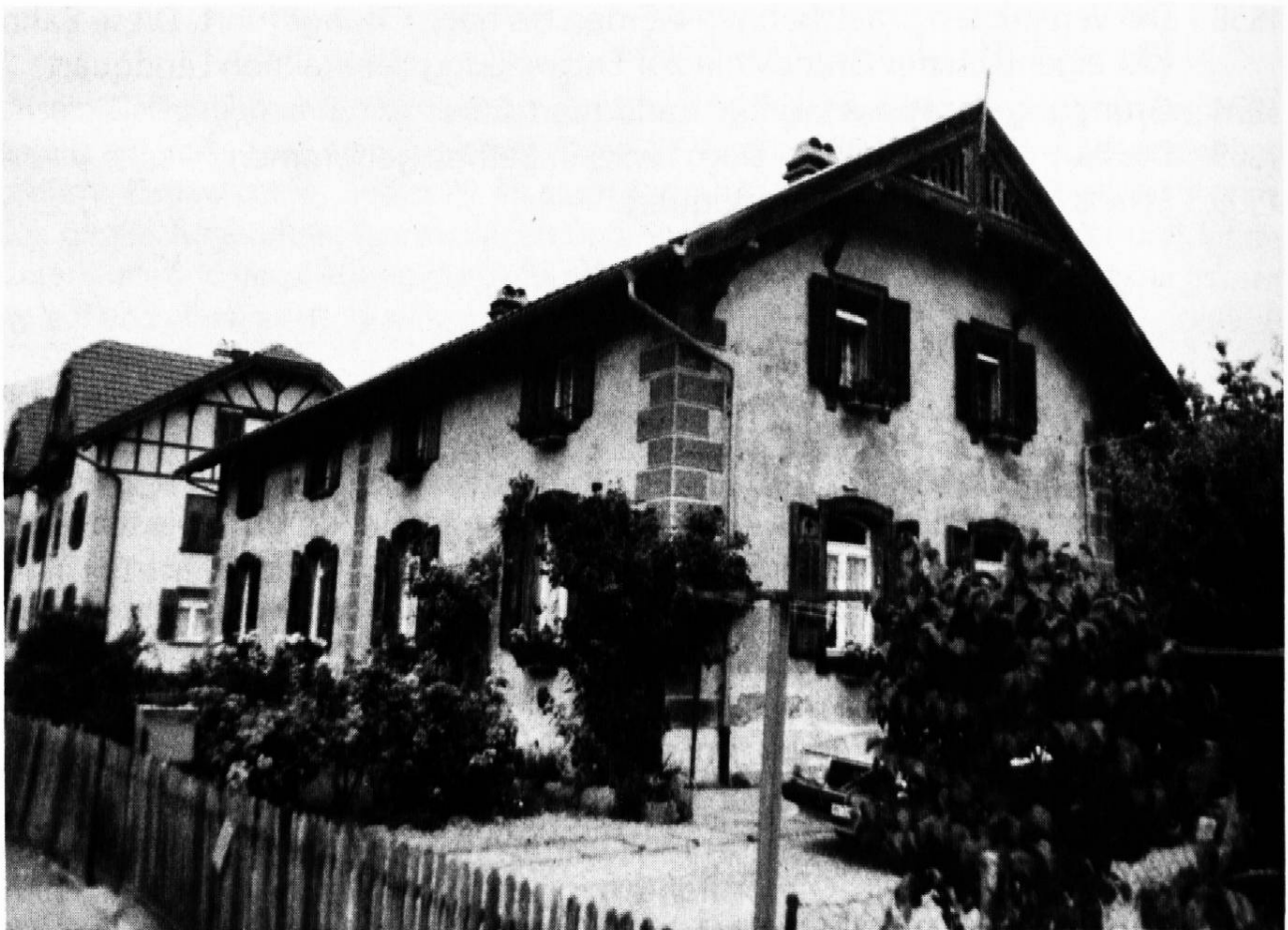
Personalhäuser aus der Gründerzeit der RhB.