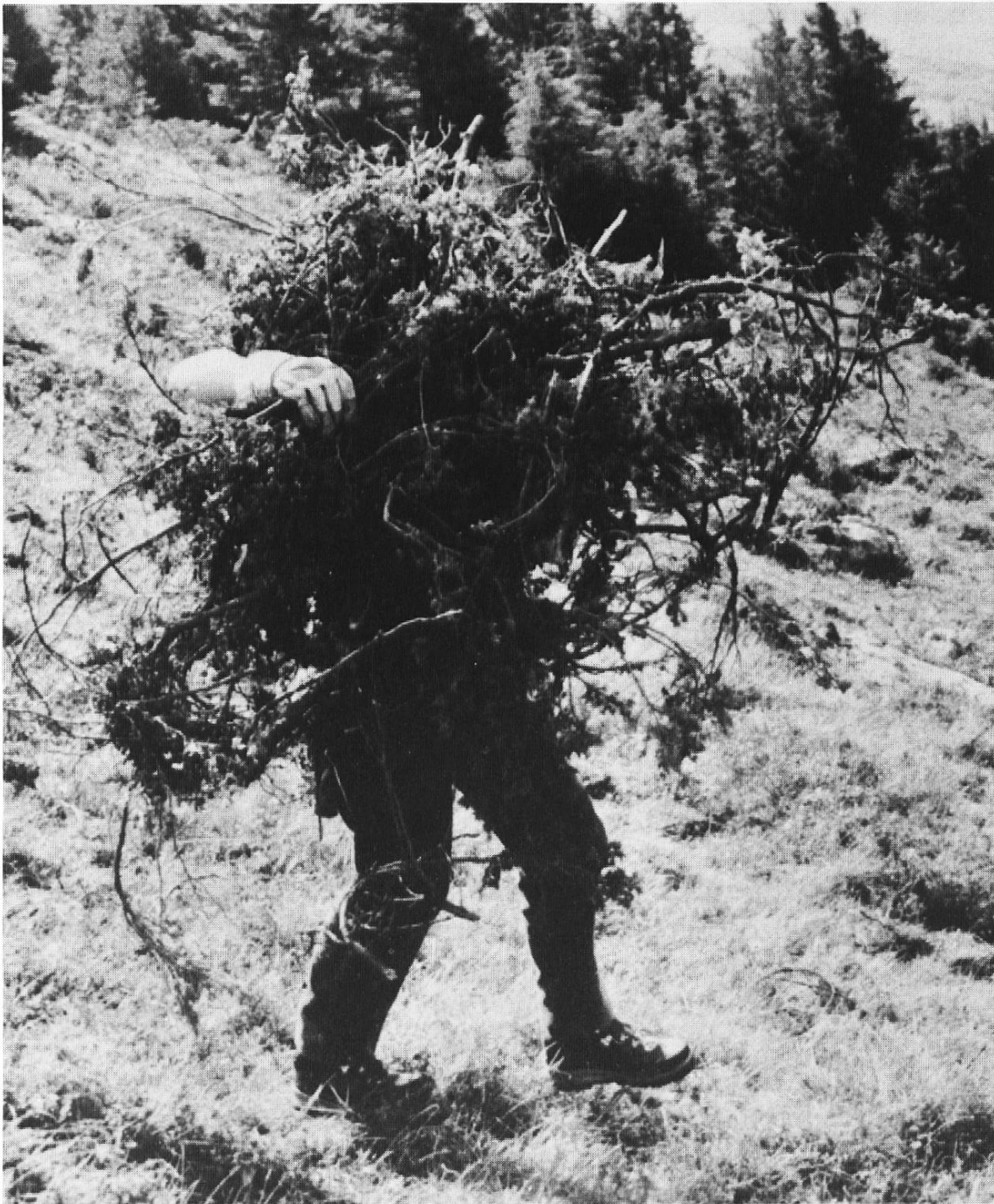
«Da läuft etwas . . .»

Ein Arbeitseinsatz bietet den Teilnehmerinnen und Teilnehmern das, was im normalen Schulbetrieb oder am Arbeitsplatz oft fehlt: Kennenlernen einer Region mit ihren Problemen; soziales Lernen beim einfachen Lagerleben; sinnvolles und praktisches Arbeiten in der Natur; Verantwortungsbewusstsein für die Umwelt entwickeln; Solidarität üben: der Stärkere hilft dem Schwächeren.