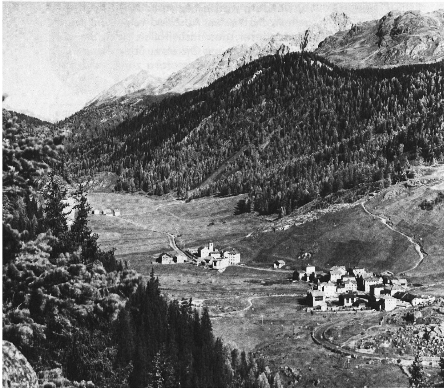
Das einstige Dorf Marmorera mit dem Weiler Cresta