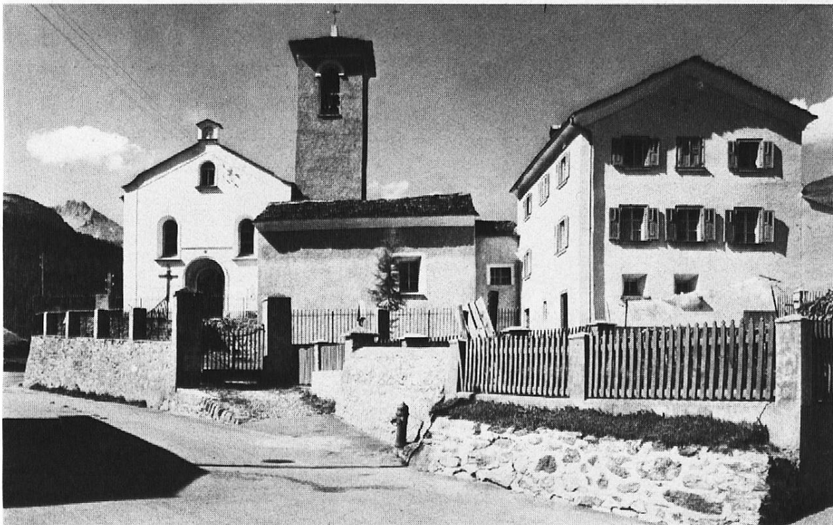
Partie aus Marmorera vor der Zerstörung des alten Dorfes

Die Verhandlungen der Stadt Zürich mit der einheimischen Bevölkerung führten verhältnismässig rasch zu einem günstigen Abschluss. Es galt, das Vertrauen dieser eher verschlossenen Gebirgsbevölkerung zu gewinnen. Um etwas zu erfahren und zu erreichen muss man mit den Leuten in ihrer Sprache reden. Es wurden viele Gespräche mit diesen Bauern geführt, so am Verhandlungstisch, auf der Strasse, unter einer Stalltür oder im Wirtshaus bei einem Glas Wein. Die Siedlung Marmorera zählte mit einer Bodenfläche von 18,9