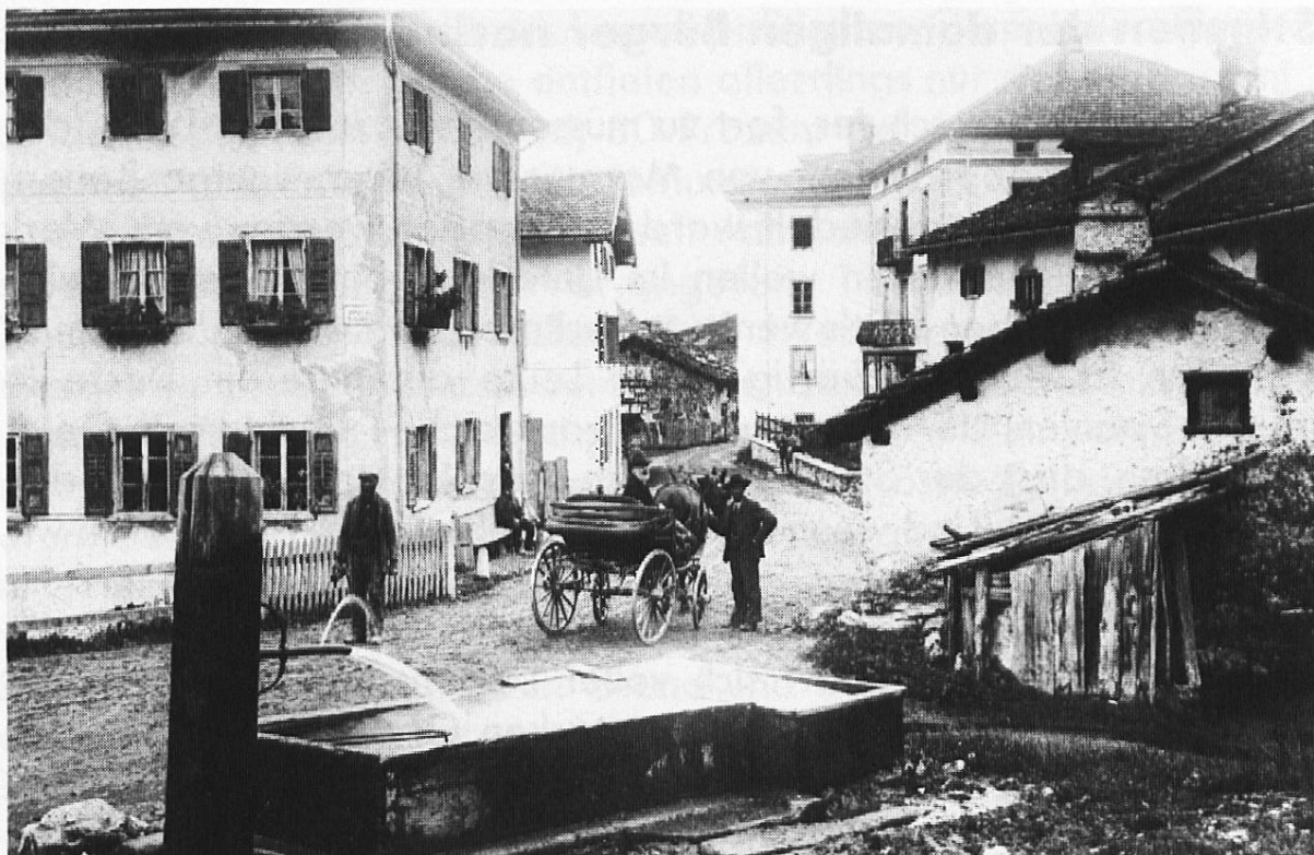
Dorfpartie von Alt-Marmorera