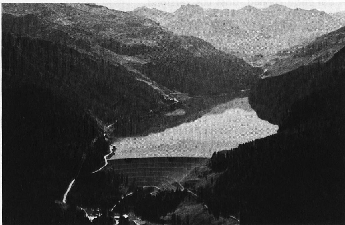
Der heutige Stausee Marmorera mit dem künstlichen Erddamm Castiletto

Am 13. November 1949 gab die Stadt Zürich «grünes Licht» zum Bau des Marmoreraerwerkes und erteilte für den Bau einen Kredit von 85 Millionen Franken. Die Bauarbeiten begannen mit der Verlegung der Julierstrasse im Dezember 1949, die nun dem See entlang führt. Die eigentlichen Bauarbeiten für das Kraftwerk wurden im Februar 1950 mit dem Umlaufstollen eingeleitet. Das Hauptmerkmal der ganzen Anlage bildet der Abschluss des Talbeckens durch einen Erddamm von riesigen Dimensionen an Stelle einer Betonmauer. Das benötigte Material zur Aufschüttung wurde aus dem Talgrund von Marmorera und an den nahen Hängen gewonnen.