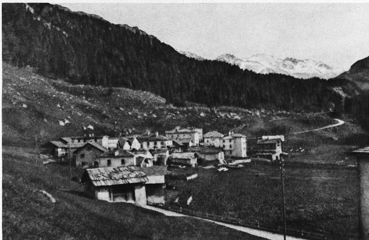
Das ehemalige, idyllische Bauerndorf Marmorera

Quadratkilometern zu den kleineren politischen Gemeinden Graubündens. Von dieser Fläche entfielen allerdings nur sieben Prozent auf den eigentlichen Talgrund, 80 Prozent auf Abhänge und Terrassen und 13 Prozent auf Gipffluren. Marmorera litt wie viele andere Dörfer in Berggebieten seit Jahrzehnten an einer zunehmenden Entvölkerung. Noch vor ungefähr 130 Jahren zählte die Ortschaft 156 Einwohner. Diese Zahl blieb mehr oder weniger konstant bis zur Jahrhundertwende, dann setzte eine beschleunigte Abnahme ein. 1943 zählte das Dorf nur noch 94 Einwohner und knapp zwei Dutzend bewohnte Häuser. Der grösste Teil der Bevölkerung lebte schlecht und recht von der kargen Scholle. Mit der zunehmenden Industrialisierung machte sich die Abwanderung immer stärker fühlbar. Unter solchen Umständen wird man den Verzicht der Einwohner auf ihren Grund und Boden sicher begreifen. Am dritten Oktobersonntag, dem 17. Oktober 1948, erteilte die Gemeindeversammlung von Marmorera mit 24 Ja gegen 2 Nein-Stimmen die Wasserrechtskonzession und gab damit ihr Dorf freiwillig preis. Keine Macht der Erde hätte sie dazu zwingen können. Zum erstenmal in der Geschichte unseres Landes hat eine Gemeinde ihren eigenen Tod beschlossen, damit eine ferne Stadt den notwendigen Strom erhalte. Zu erwähnen ist noch, dass einige Häuser Witwen gehörten, die natürlich (wie alle weiblichen Einwohner) keine Möglichkeiten hatten, ihren Willen mit dem Stimmzettel auszudrücken.