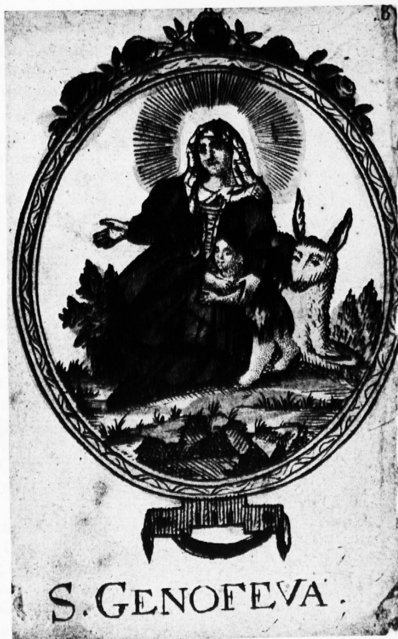
5 Kleines Andachtsbild (18. Jahrhundert), gebraucht in Vignogn, 7 × 11,5 cm, Sammlung des Bistums Chur

angestammten Rechte wieder. Der geistliche Verfasser der Legende wandelte nun die französische Königin in eine Brabanter Fürstin mit dem Namen der in der Laacher Region besonders verehrten hl. Genovefa von Paris um, ihr Mann erhielt den Namen des Klostergründers, Pfalzgraf Siegfried von Ballstädt. An die Stelle des ungetreuen Marschalls trat ein Freund des Ehemanns, Golo. Die verstossene Genovefa lebt nicht vom Erlös ihrer Spinnarbeiten, sondern ernährt sich und ihr Kind mit der Milch einer Hirschkuh, die ihr die Gottesmutter zuführt; das Tier leitet später auch den auf der Jagd befindlichen Pfalzgrafen zur Höhle. Die Pfalzgräfin stirbt im Schloss bald nach den überstandenen Leiden. Golo wird auf Anordnung des Pfalzgrafen von vier Ochsen zerrissen. Der Kapuzinerpater Martin von Cochem übersetzte 1687 die Legende ins