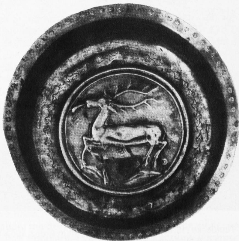
1 Taufschale (um 1500), gebraucht in Trin, ø 23,7 cm, Rät. Museum Inv.Nr. H 1970, 1226

Auf Bildern des ersten Menschenpaares im Paradies wird Christus, der Überwinder der Schlange, häufig durch den Hirsch im Hintergrund symbolisch repräsentiert. Der Physiologus erwähnt nicht nur das vom Hirsch ausgespuckte Wasser, die göttlichen Heilslehren, sondern nennt auch Wasser und Blut, die aus der Seite Christi fließen. Er stützt sich hier auf die Bibelstelle Johannes 19, 33–34: «Als sie aber zu Jesus kamen und sahen, dass er schon gestorben war, brachen sie ihm die Beine nicht, sondern der Kriegsknechte einer öffnete seine Seite mit einem Speer, und alsbald ging Blut und Wasser heraus.» Wegen diesem Sinnzusammenhang mit dem Kreuzestod Christi ist der Hirsch zudem Symbol für die Eucharistie, das Altarsakrament. Schon auf einem Hostienmodell des 4. Jahrhunderts aus Karthago erscheint das Tier zwischen stilisierten Ranken mit der Umschrift: «Ich bin das lebendige Brot, das vom Himmel herabgekommen ist.» Daneben finden wir den Hirsch auf Hostienbüchsen und Paramenten. Eine unmittelbare Beziehung zur Taufe stellte der Kirchenlehrer Augustin († 354) mit seiner Neuinterpretation von Psalm 42,2 her. Wie der durstige Hirsch nach frischem Wasser schreit, so sehnt sich der sündige Mensch nach Erlösung, die er durch das reinigende Wasser der Taufe erhält. Daher zieren häufig Hirsche Taufschalen und ihre Tragvorrichtung. Die in Trin gebrauchte, um 1500 zu datierende Taufschale, stammt möglicherweise aus einer Nürnberger Werkstatt (Abb. 1).