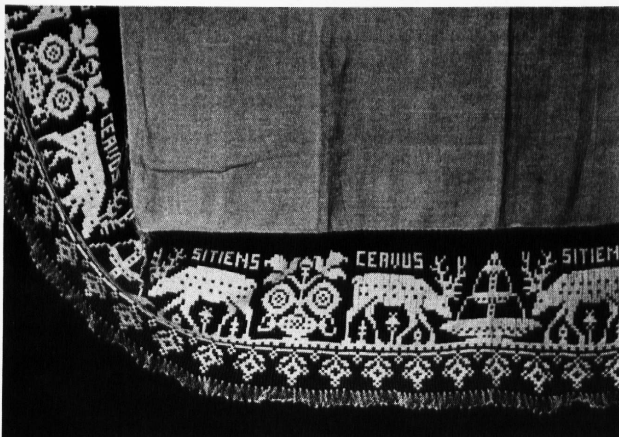
3 Altardecke (19. Jahrhundert), gebraucht in Curaglia, 100×190 cm, Rät. Museum Inv. Nr. H 1972, 2438 (Ausschnitt)

Attribut ist wegen seines Symbolcharakters unverständlich ohne die genaue Kenntnis der Legende. In Analphabetenkalendern, die vom 16. bis ins 18. Jahrhundert massenhaft Abnehmerschaft fanden, genügte für die legendenkundigen Konsumenten bei den Festen der Heiligen Eustachius (20. September) und Hubertus (3. November) die Darstellung eines Hirschgeweihs mit leuchtendem Kruzifix in der Mitte. Wie kamen die Heiligen, die von den Jägern als Schutzpatrone angerufen wurden, zu ihrem Attribut? Die Legende erzählt, dass Placidus, dem Jäger und Heerführer des römischen Kaisers Trajan auf der Jagd ein Hirsch erschienen sei, der zwischen seinem Geweih den Gekreuzigten in grossem Strahlenglanz trägt. Er stürzt vom Pferd und vernimmt die Worte: «Warum verfolgst du mich? . . . Ich bin Christus, der den Himmel und die Erde erschaffen hat, ich liess das Licht aufgehen und teilte die Finsternis.» Darauf lässt sich Placidus taufen und erhält den Namen Eustachius. Im 15. Jahrhundert verlagerte sich die Eustachiuslegende und somit auch die Jägerikonographie auf den hl. Hubertus (Abb. 4), den ersten Bischof von Tongern († 727). Die Jäger verehrten seither zwei Patrone, von denen Hubertus jedoch stets der volkstümlichere blieb.