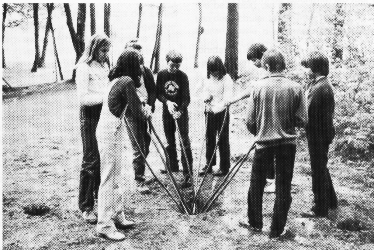
Sautreiben (nachgestellt von einer Churer Schulklasse)

Diese Statistik beweist einmal mehr, dass die Bündner Lehrerinnen und Lehrer sehr fortbildungsfreudig sind!