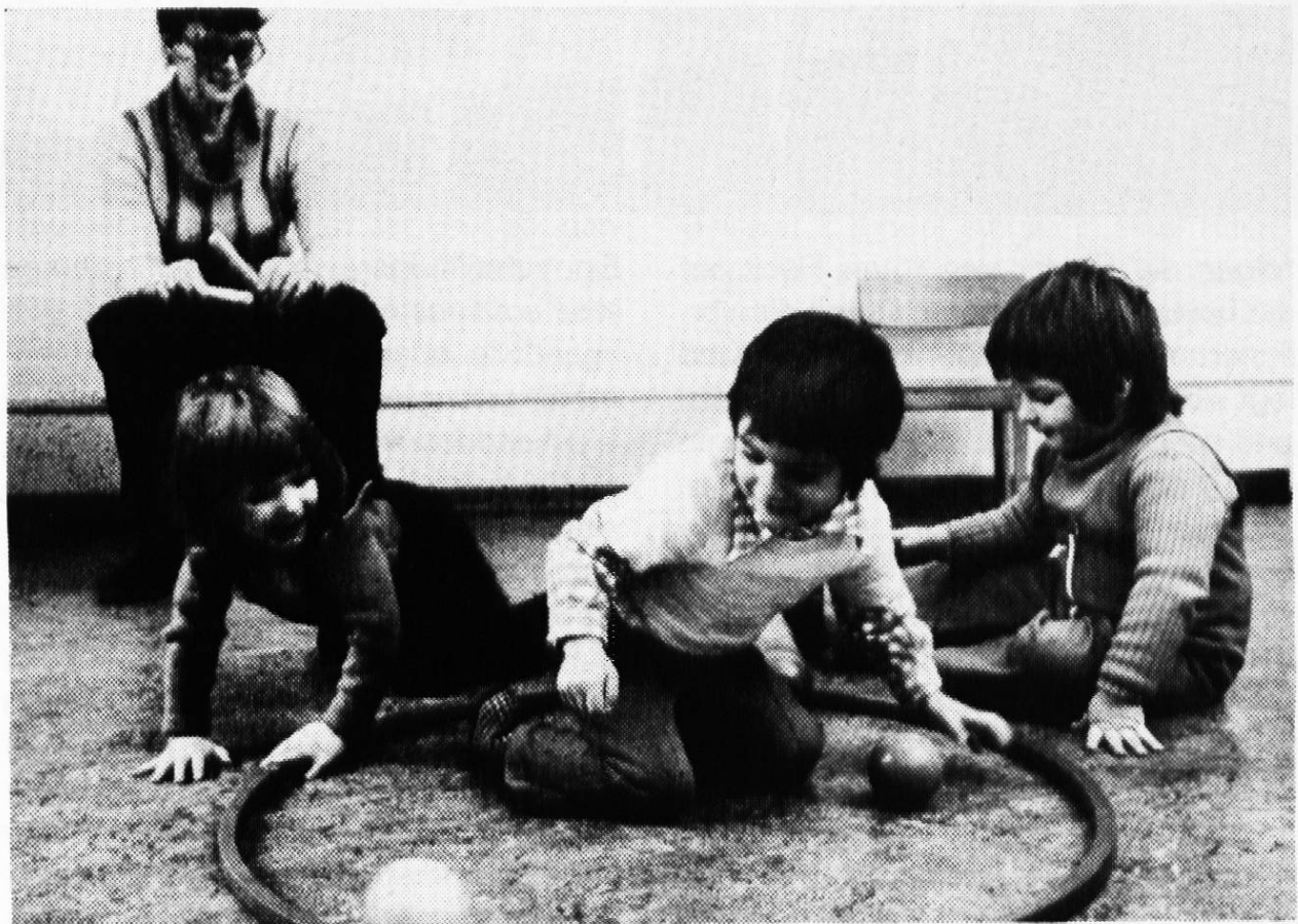
In einer Rhythmikstunde ergeben sich für die Gastarbeiterkinder keine Verständigungsschwierigkeiten.

«Der Mensch weist praktisch allen Dingen, mit denen er sich umgibt, Funktionen zu. Seine Dingwelt hat die Struktur des um-zu. Sie ist, um mit Heidegger zu sprechen, primär nicht vorhanden , sondern zuhanden . Das gilt ebenso für die Dingwelt der Kinder wie für die der Erwachsenen. Der Unterschied liegt aber darin, dass Erwachsene den Din-