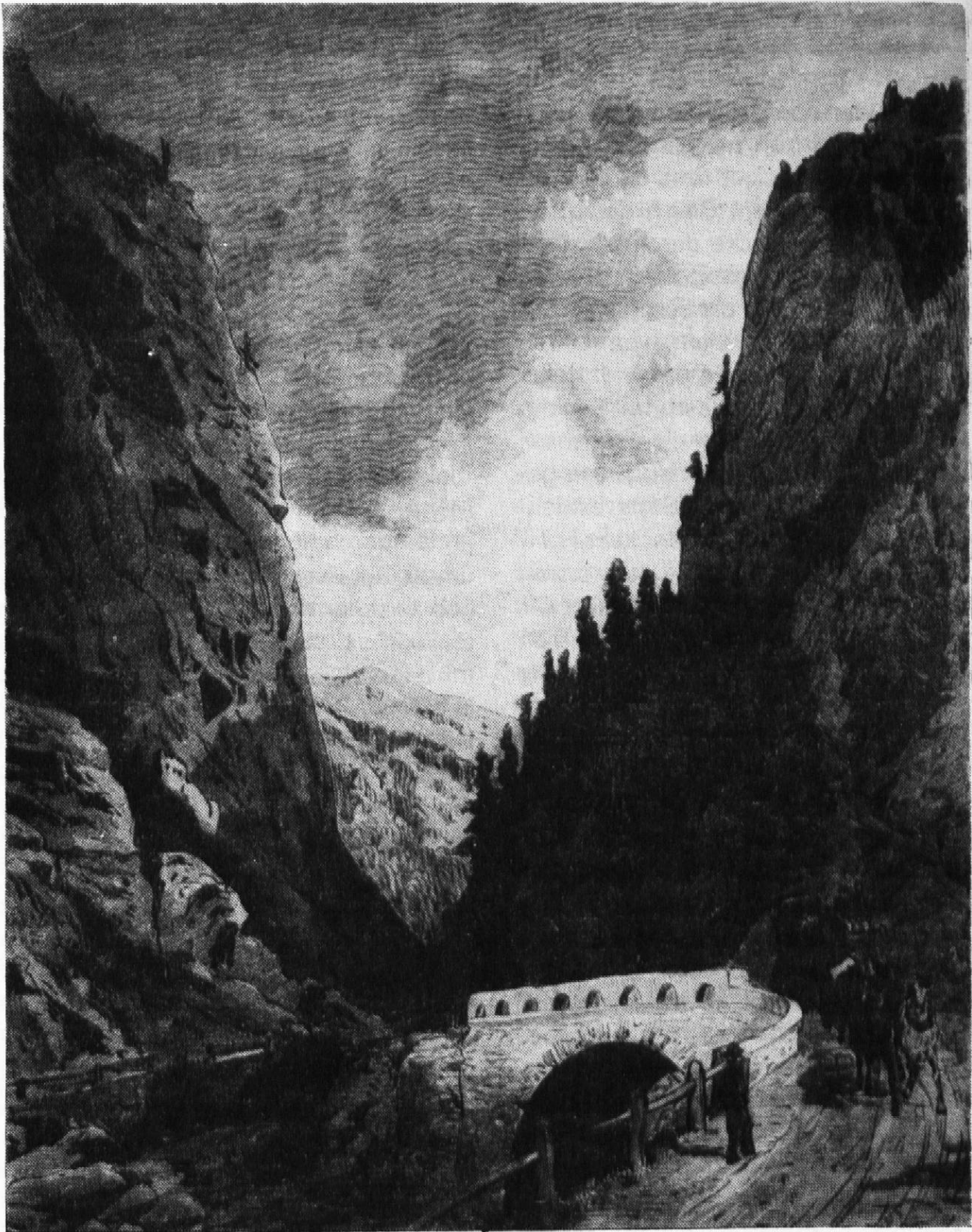
Die Schlossbrücke in der Klus