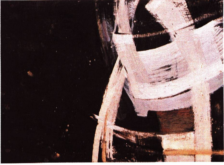
TRIARCH 1973, Öl auf Leinwand, Bündner Kunsthaus