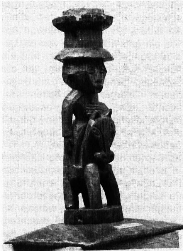
Reiter, Arvenholz, 62,5 cm hoch. Kirchner ist schon 1904 auf die Ausdruckskraft der Plastik der Naturvölker aufmerksam geworden. Er schuf für sein Davoser Atelier geschnitzte Möbel, welche durch die Plastik der Naturvölker inspiriert wurden.

Die Angst, nach der Heilung von neuem zum Militärdienst aufgeboten zu werden, führte zu neuen Krisen. Über den damaligen Gesundheitszustand des Künstlers berichtete Grisebach an Helene Spengler: «Zwei Vormittage war ich bei Kirchner, die mir unvergesslich bleiben werden. In einem gelb ausgestrichenen schrägen Dachraum sass er auf ganz niedrigem Sessel neben