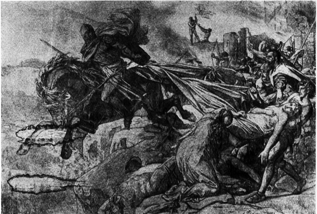
Ernst Stückelberg: «Der letzte Ritter von Hohenrätien». Kohle-Entwurf, 1882, 155 x 208

rade in der Bilddarstellung wesentlich von den Versen Nessler's ab. Der Zwingherr hat aus einer Hochzeitsgesellschaft die Braut geraubt und sie auf die Burg entführt. Empört stürmt in der Folge das Volk die Festung. Ernst Stückelberg schildert nun auf seinem Bild die letzten Minuten der dramatischen Ereignisse im Burghof, bevor sich der Tyrann auf seinem Pferd in die Tiefe stürzt.