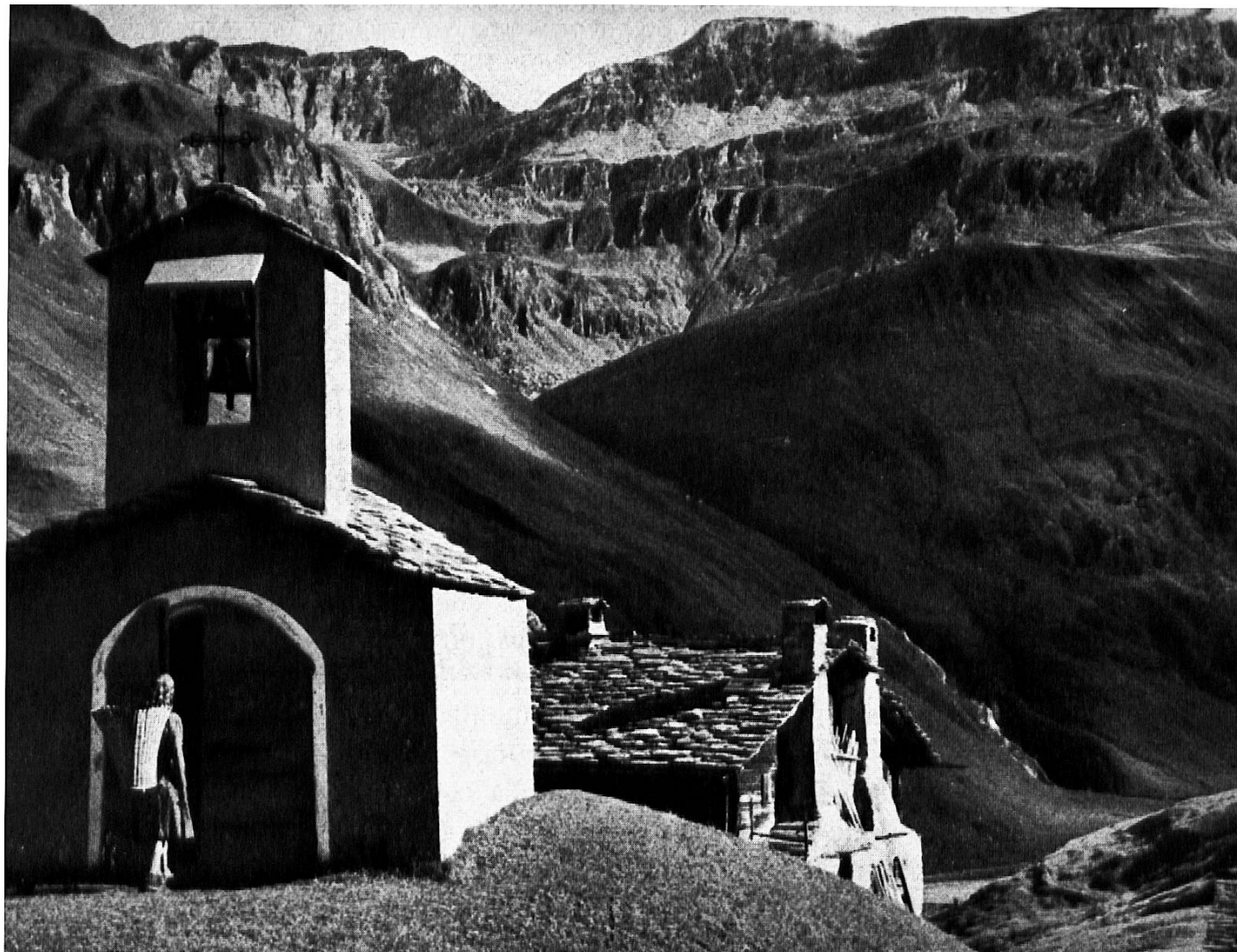
Kapelle bei Vals