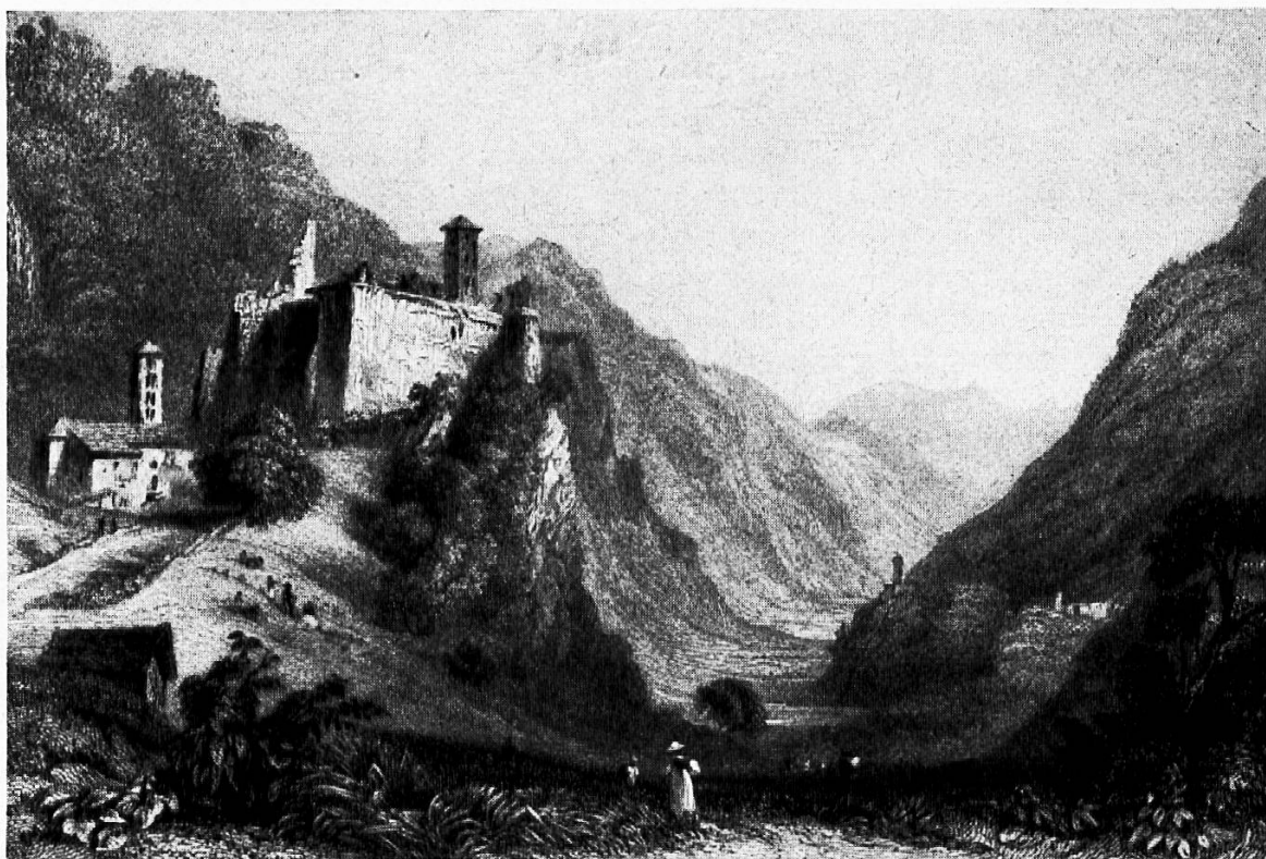
Burgruine Mesocco (Stich aus dem 19. Jahrhundert)

Bellinzona, vom Bach von Lumino weg, das Schloß Misox und der Palast in Roveredo inbegriffen, überhaupt nichts ausgenommen. Er genießt die gleichen Rechte und hat die nämlichen Pflichten wie alle anderen Bundesmitglieder. Er und seine Leute haben auch den Bund beschworen.