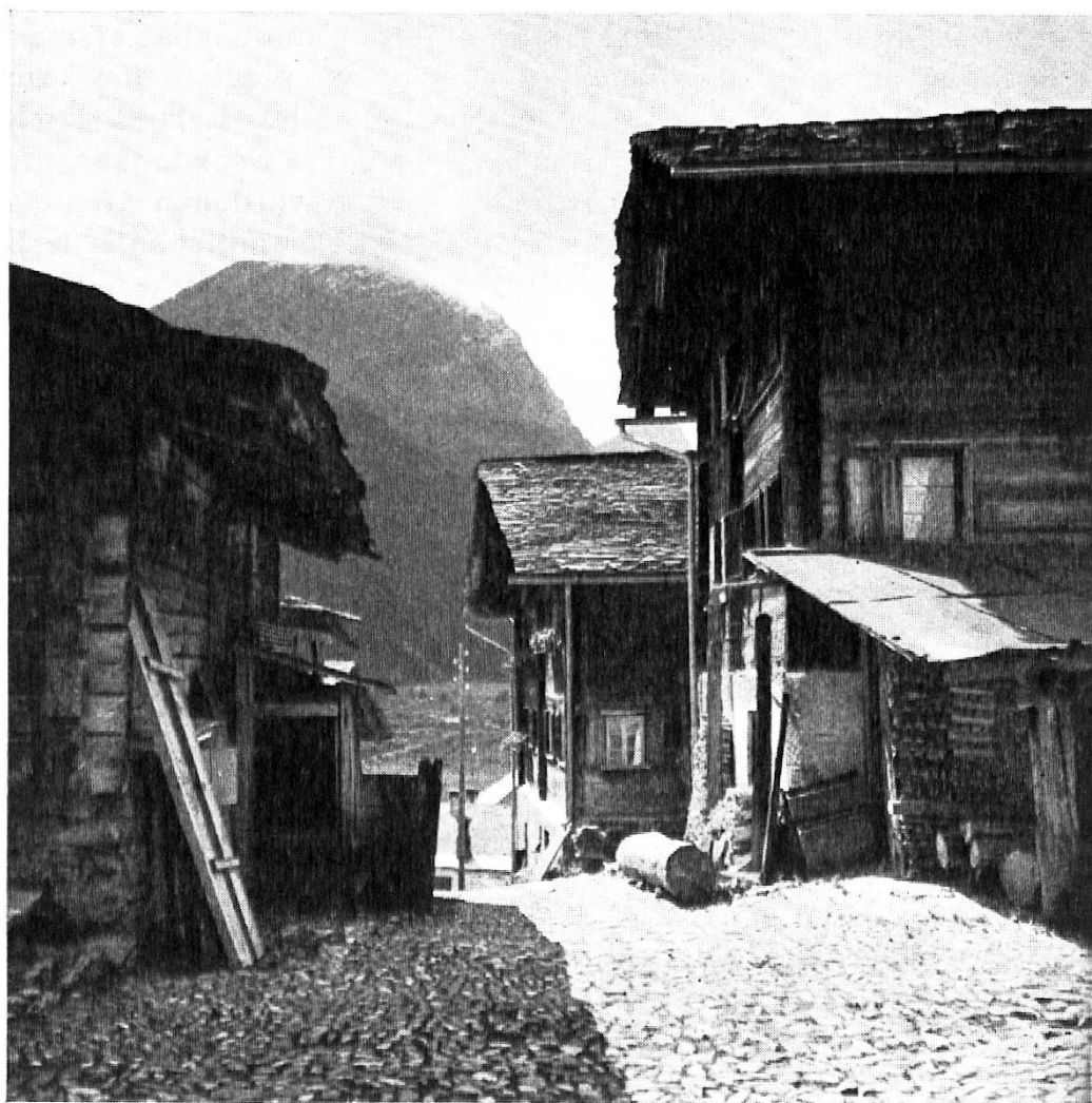
Walser Holzhäuser „auf der Bsetzi“ (Rheinwald)

Nach dem gewaltigen Einbruch in das europäische Geistesleben, der von der materiellen Seite her erfolgte, der sich unter dem Einfluß der klassischen Physik und ihrer Denkformen der strengen Kausalität zwischen der Renaissance und der Gegenwart vollzogen hat, der sich in der modernen Technik, in der Weltwirtschaft, in der sozialen und politischen Struktur der Gegenwart aufweisen läßt und unter Anwendung einiger weniger mechanistischer Grundgesetze und Grundprinzipien auf den Bereich des gesamten Lebens, vorerst zur Trennung von Geisteswissenschaft und Naturwissenschaft, alsdann zur Auflösung der Universitas literarum führte, die Universitäten und Hochschulen in Fachschulen verwandelte, aber auch das Gebäude der Kirche gewaltig bedrohte, weil in diesem ausschließlich durch die Gesetze der Kausalität und die Ratio gelenkten Dasein kein Raum für das Transzendente und Seelische vorhanden ist, entstand der rein zweckgerichtete Materialismus unserer Zeit, der seine politische Form in der hochkapitalistischen, kommunistischen, nazistischen oder irgendeiner anderen der absolut gesetzten modernen Staats- und Wirtschaftslehren durchzusetzen versucht. Dem glanzvollen technischen Aufstieg, wie er in der