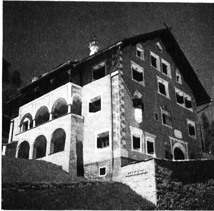
Engadiner Museum in St. Moritz

mantischen oder historischen Liebhaberei oder zu rein zweckgerichteter nationalistischer Propaganda — zwei Möglichkeiten, die im Beraume der materialistischen Denkweise und Weltanschauung unserer Zeit durchaus offen bleiben, die eine als Flucht vor den Aufgaben der Gegenwart, die andere als zweckdienliches Mittel der politischen Ratio.