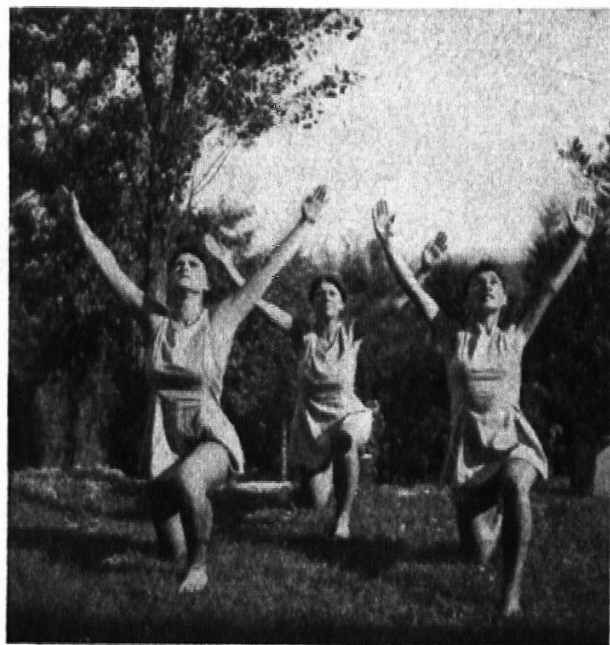
Arbeit in der Gemeinschaft

Die Schule darf nun der Verpflichtung, den Mädchen auf körper-erzieherischem Gebiet zu seinem Recht zu verhelfen, nicht entbunden werden. Die Aufgabe wird heute aber noch ungenügend gelöst, leider begnügte sich die Erziehungsdirektoren-Konferenz im Jahre 1940, bei der Behandlung der Mädchenturnfrage, mit einer entsprechenden Empfehlung an die kantonalen Erziehungsdepartemente. Sie tat es in der Annahme, eine sehr große Mehrheit aller Mädchen erhalte Turnunterricht. Die Erhebungen der «Körpererziehung» stellten daraufhin mit aller Deutlichkeit fest und private Informationen bestätigten es für unsern Kanton