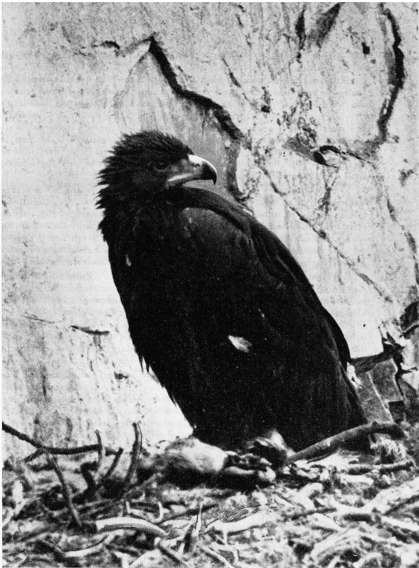
Junger Steinadler im Horst Piz Albris.