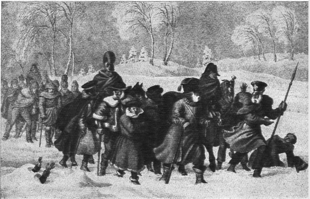
Rückzug aus Rußland, nach einem Gemälde von Faber du Fauré.

begeisterte Feier Napoleons und seiner treuen Garde. Das Gedicht entstand 1819, als Heine in Düsseldorf sich für die Universitätsstudien vorbereitete. «Auf der Bank des alten Hofgartens sitzend, hörte ich hinter mir verworrene Menschenstimmen, welche das Schicksal der armen Franzosen beklagten, die, im Russischen Feldzuge nach Sibirien geschleppt, dort mehrere Jahre, obgleich schon Frieden war, zurückgehalten worden und jetzt erst heimkehrten. Als ich auf sah, erblickte ich wirklich diese Waisenkinder des Ruhmes; durch die Risse ihrer zerlump-