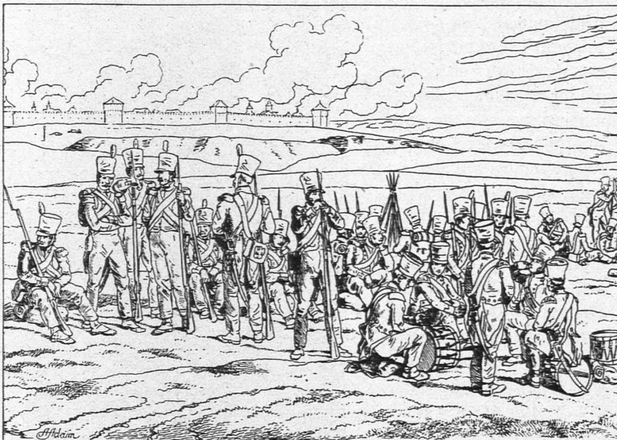
Grenadiere vor Smolensk

Kriegsschule Brienne: Sein ungewöhnlicher Ernst hielt die Mehrzahl seiner Mitschüler von ihm fern, doch fehlte es ihm nicht ganz an Freunden, denen er später sich dankbar erwies... als Hauptmann einer Schülerkompagnie wußte er sich durch