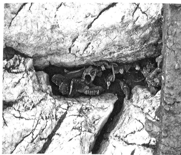
Fig. 14. La Sarraz/EclépensVD, Le Mormont. Fosse 722. Dépôt d'ossements animaux au fond de la fosse, dégagé sur sa moitié sud-est.