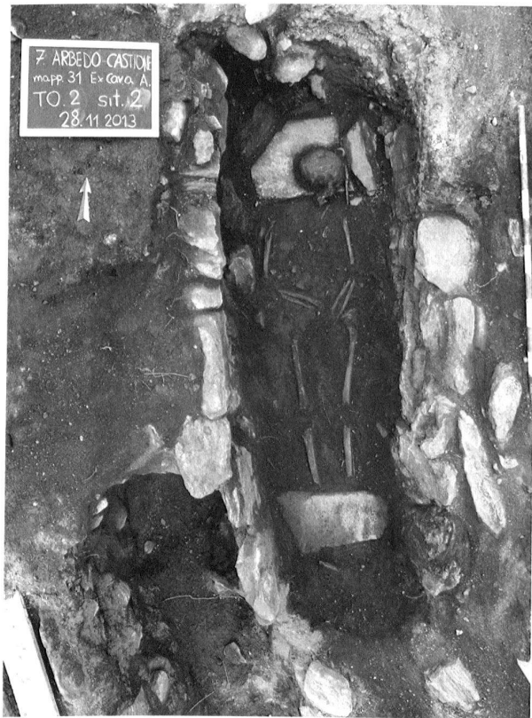
Fig. 10. Arbedo-Castione TI, Galletto. Tomba 2.

Im Areal der Novartis AG wurde die Ausgrabung im Bereich des Gräberfeldes A fortgesetzt und abgeschlossen (2012/18). Ziel war es, alle 2006 noch nicht ergrabenen Zonen nördlich und südlich des unterkellerten und nun rückgebauten Gebäudes WSJ-68 archäologisch zu untersuchen. Leider zeigte sich, dass diese vor-