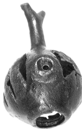
Abb. 11. Baar ZG, Schmalholz. Bommelhängerfragment aus Bronze. Maximale Länge 3,05 cm.