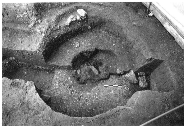
Fig. 12. Chevenez JU, Au Breuille II. Foyer aménagé au fond d'une imposante fosse (vidange) ; les restes du foyer sont mêlés à de grands fragments de torchis brûlé.

Bibliografia : L. Tori/E. Carlevaro/Ph. Della Casa et al., La necropoli di Giubiasco (TI). I, Storia degli scavi, documentazione, inventario critico. Collectio archaeologica 2. Zurigo 2002; L. Pernet/E. Carlevaro/L. Tori et al., La necropoli di Giubiasco (TI). II, Les tombes de La Tène finale et d'époque romaine. Collectio archaeologica 4. Zurigo 2006; L. Tori/E. Carlevaro/Ph. Della Casa et al., La necropoli di Giubiasco (TI). III, Le tombe dell'età del