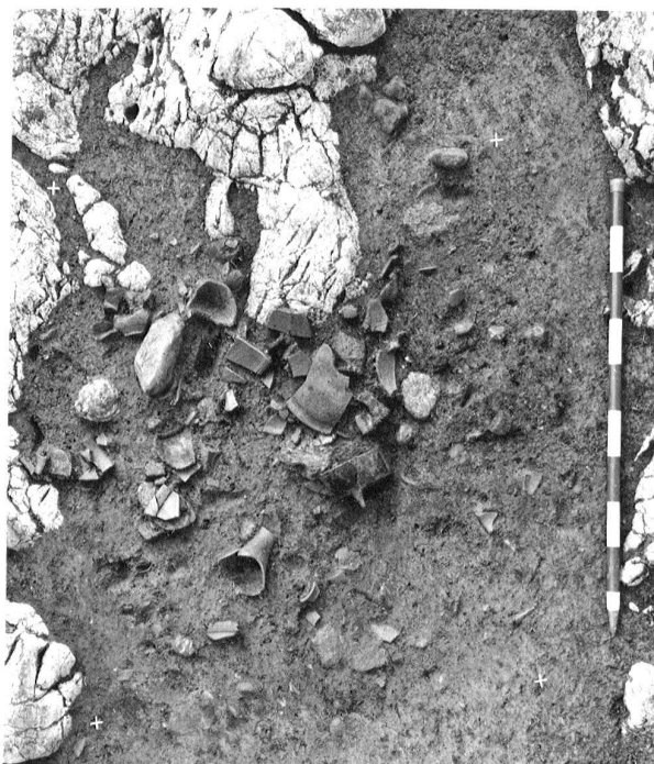
Fig. 13. La Sarraz/EclépensVD, Le Mormont. Fosse 712. Dépôt composé de fragments de céramiques appartenant à plusieurs vases, dont une marmite tripode.

Bibliografia: P.A. Donati, Locarno. La necropoli romana di Solduno. Catalogo dei materiali. Quaderni d'informazione 3. Bellinzona 1979 (ristampa 1988); R. Cardani Vergani, Ricerche archeologiche in Ticino nel 2005. Bollettino Associazione Archeologica Ticinese 18, 2006, 28-31; Ricerche archeologiche in Ticino nel 2006. Bollettino Associazione Archeologica Ticinese, 19, 2007, 28-31; R. Cardani Vergani/C. Mangani/D. Voltolini, Necropoli di Solduno (Locarno TI): scavi UBC 1995-2002. AAS 94, 2011, 61-102; AAS 96, 2013, 206s.