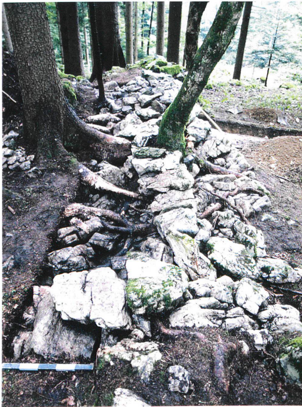
Abb. 7. Lungern OW, Balmiwald, Zigeunerlager (= Abb. 1,3). Blick von Norden auf die mittelalterliche oder (früh)neuzeitliche Trockenmauer.