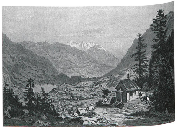
Abb. 2. Lungern OW, Paradeplatz und Matti Schanz (= Abb. 1,1). Die um 1619 errichtete und um 1898 abgebrochene Kapelle bei den so genannten Chäppelstiegen (Zustand vor 1886). Im Hintergrund der Lungernsee. Stich von Franz Odermatt, Hergiswil. Nach Dokumentation IVS, Abschnitt OW 3.2.9.

Die (früh)neuzeitlichen Quellen liefern zudem eine Erklärung, warum sich die ehemals wohl recht massiven Sperrmauern im Gelände nur noch punktuell nachweisen lassen: Zum einen bestanden diese – wie aus dem Tagebuch des Landhauptmanns Schmid aus dem Jahr 1712 hervorgeht – zum Teil aus Holz 23 , zum anderen musste Obwalden nach