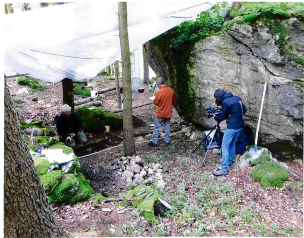
Abb. 10. Lungern OW, Balmiwald, Findling (= Abb. 1,4). Blick von Norden auf die künstlich ausgeebene Fläche zwischen der Trockensteinmauer (links) und dem Findling (rechts).

Steinen und wenig Holzkohle durchsetzte Unterboden (Bv-Horizont), der den anstehenden Kalkstein überlagert. Bei den verschiedenen kleineren Steinkonzentrationen auf dem Ah-Horizont dürfte sich um verstürzte Teile der N-S-verlaufenden Trockensteinmauer handeln. Funde, die Hinweise zur Funktion und Datierung der Baustrukturen hätten liefern können, kamen nicht zum Vorschein.