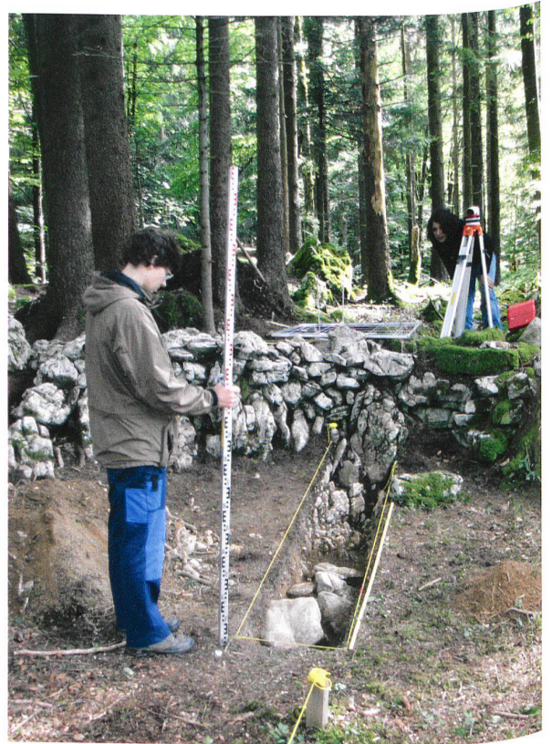
Abb. 8. Lungern, OW Balmiwald, Zigeunerlager (= Abb. 1,3). Blick von Westen an die mittelalterliche oder (früh)neuzeitliche Trockensteinmauer. In der Bildmitte Sondierschnitt S1.

Steinschlag schützen sollte, sprechen die Lage, die massive Bauweise sowie die historischen Quellen dafür, dass es sich um eine der Letzinen bzw. Sperrmauern handelt, die im Zuge der kriegerischen Auseinandersetzungen zwischen Bern und Obwalden errichtet bzw. instand gestellt wurden 27 . Funde, die eine genauere zeitliche Einordnung ermöglichen würden, kamen aber weder am Fuss der Trockensteinmauer noch in den beiden Sondierschnitten im Bereich der Hinterfüllung zum Vorschein.