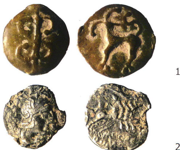
Abb. 13. Lungern OW, Cholhüttliwald und Sewli (= Abb. 1,7; 18). 1 Spätlatènezeitliche Potinmünze des Zürcher Typs (Av. und Rv.); 2 um 125 v. Chr. geprägter republikanischer Denar (Av. und Rv.); M ca. 2:1.