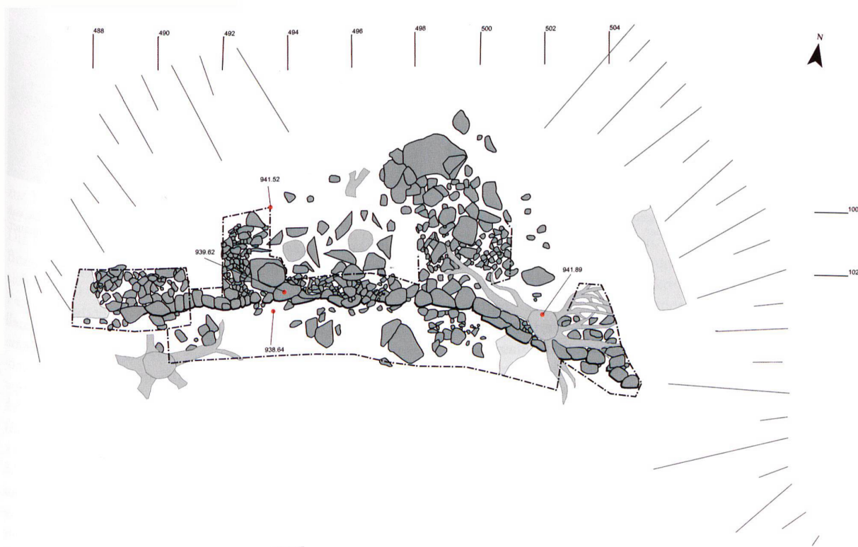
Abb. 6. Lungern OW, Balmiwald, Letzi (= Abb. 1,2). Aufsicht der mittelalterlichen oder (früh)neuzzeitlichen Letzimauer. Feldaufnahme J. Bucher; Umsetzung P. Nagy/D. Schuhmann.

2.1 m hoher Mauerabschnitt (Abb. 4) untersucht sowie zeichnerisch und fotografisch dokumentiert 26 . Die Frontseite der leicht bogenförmigen Trockensteinmauer besteht aus unterschiedlich grossen, sorgfältig aufeinander geschichteten Kalkbruchsteinen. Die unterste Steinlage folgt weitgehend dem Geländereief und scheint auf dem anstehenden Fels zu liegen (Abb. 5). Ob die mehr oder weniger horizontale Oberkante der nicht mehr auf ihrer gesamten Länge erhaltenen und teilweise verstürzten Baute der ursprünglichen