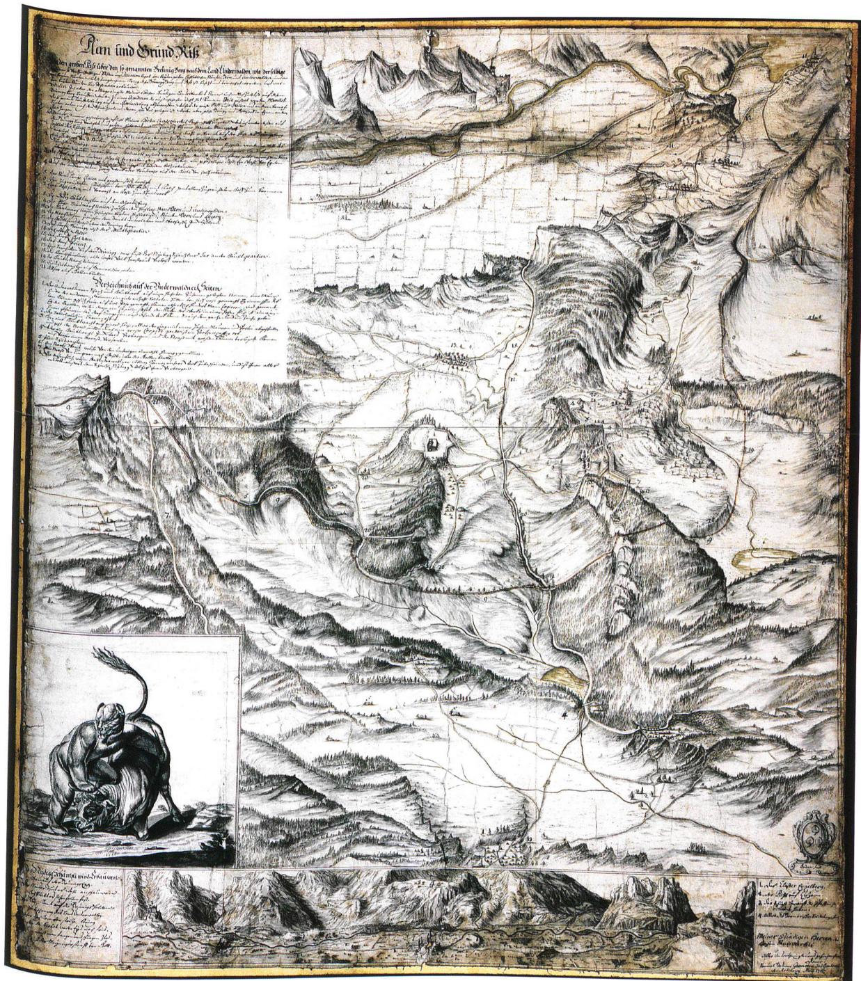
Abb. 12. «Plan und Grundriss von dem grossen Pass über den so genannten Brünig Berg» des Samuel Bodmer aus dem Jahr 1712. Staatsarchiv des Kantons Bern, AA IV Oberhasli 5.

beispielsweise über die Fluren Hagsfluewald, Rüti, Chlusiwald und Oberbrünig. Diese Nebenwege wurden unter anderem im 17. Jh. von Obwaldner Viehhändlern genutzt, um die bernische Zollstation auf dem Brünigpass zu umgehen 40 . Die Existenz mehrerer Saumpfade und Wege im Gebiet des Brünigpasses bezeugt aber nicht nur die um 1712 entstandene Brünigkarte des Samuel Bodmer (Abb. 12), sondern