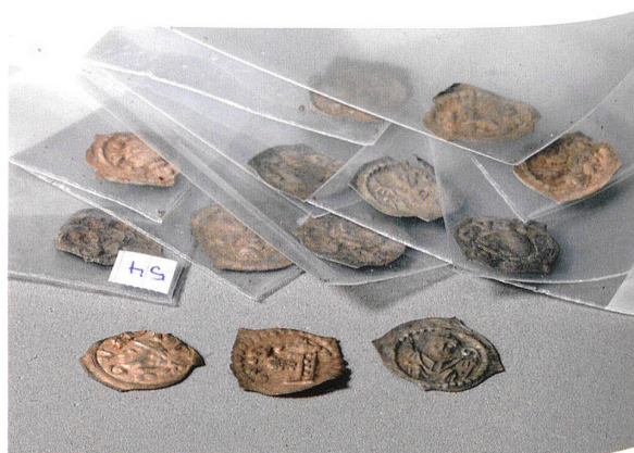
Abb. 14. Lungern OW, Sewli (= Abb. 1,8). Ein Teil des über 121 einseitig geprägte Silberpfennige umfassenden Münzenssembles aus dem späteren 13. Jh.