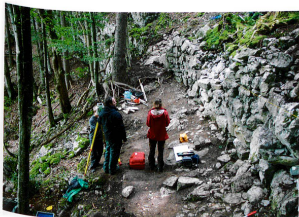
Abb. 4. Lungern OW, Balmiwald, Letzi (= Abb. 1,2). Blick von Osten auf die Überreste der mittelalterlichen oder (früh)neuzzeitlichen Letzimauer.