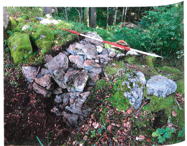
Abb. 3. Lungern OW, Paradeplatz und Matti Schanz (= Abb. 1,1). Freigelegter Abschnitt der mittelalterlichen oder (früh)neuzeitlichen Letzimauer in der Nähe der so genannten Chäppelstiege. Blick nach Südosten.

der Niederlage des Sonderbunds im Dezember 1847 einen Teil der Kriegskosten übernehmen und ausserdem die «Schanzen auf dem Brünig schleifen» 24 .