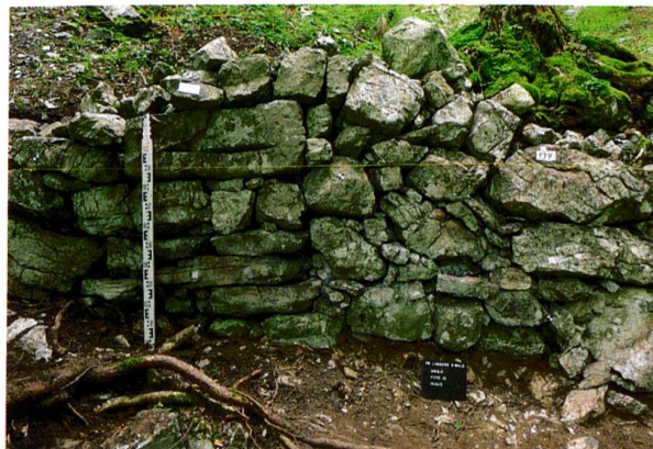
Abb. 5. Lungern OW, Balmiwald, Letzi (= Abb. 1,2). Blick von Süden an die Front der mittelalterlichen oder (früh)neuzzeitlichen Letzimauer. Die gut erkennbare Baufuge spricht für Mehrphasigkeit.