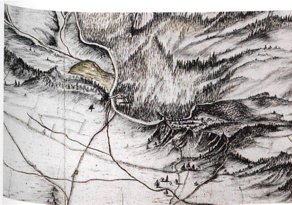
Abb. 9. Ausschnitt aus dem um 1712 entstandenen «Plan und Grundriss von dem grossen Pass über den so genannten Breünig Berg» des Samuel Bodmer (s. auch Abb. 12). Staatsarchiv des Kantons Bern, AA IV Oberhasli 5.