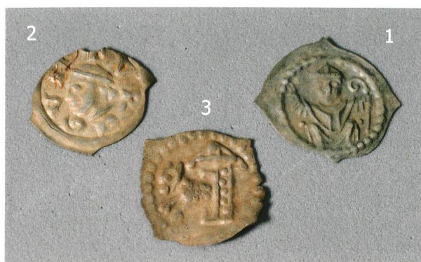
Abb. 16. Lungern OW, Sewli (= Abb. 1,8). Die im Münzensensemble am häufigsten vertretenen Silberpfennige aus dem 13. Jh. (s. auch Abb. 15): 1 Bistum Basel; 2 Fraumünsterabtei Zürich; 3 Stadt Schaffhausen. M ca. 2:1.

vertreten. Diese ungleiche Verteilung – in unserem Fall stellen zwei Typen 110 von mindestens 121 Exemplaren – könnte darauf hindeuten, dass das ganze Ensemble oder Teile davon innerhalb einer kurzen Zeitspanne dem Geldumlauf entnommen wurden.