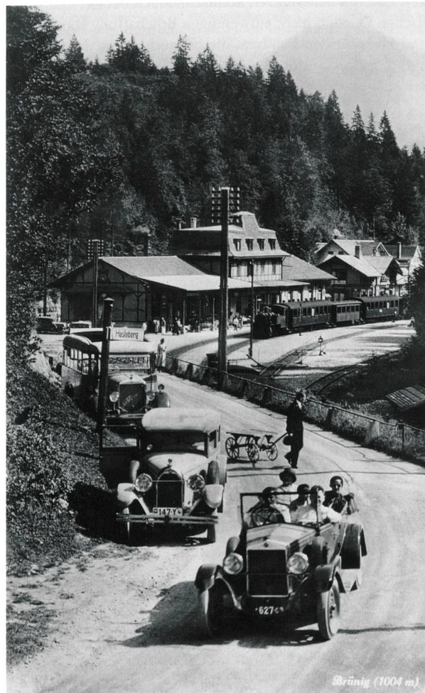
Abb. 18. Lungern OW, Brünigpass. Wohl zwischen 1926 und 1940 entstandene Postkarte mit der Bahnstation Brünig-Hasliberg. Der Bau der Brünigbahn (1888) und der Ausbau der Kantonsstrasse (1936) wurden leider ohne archäologische Begleitung durchgeführt. Digitalisat Historisches Museum des Kantons Obwalden, BB_Brünig (1004m)_L6986_Photoglob Wehrl+Vouga+coA-G, Zürich 001_z.

in den Gebieten Balmiwald, Chluiswald, Oberbrünig und Cholhüttliwald zum Vorschein gekommen sind. Im Bereich des nördlichen Zugangs zum Brünigpass haben die bis in das 19. Jh. hinein von kleineren und grösseren Grenzstreitigkeiten und kriegsähnlichen Ereignissen geprägte Beziehung zwischen Bern und Obwalden im Mittelalter und in der (frühen) Neuzeit im Brüniggebiet mehr Bodendenkmäler hinterlassen, als aufgrund der älteren Forschungen zu vermuten war 73 . Es handelt sich dabei vornehmlich um Überreste der in den historischen Quellen verschiedentlich erwähnten, im Gelände aber nur schwer auffindbaren