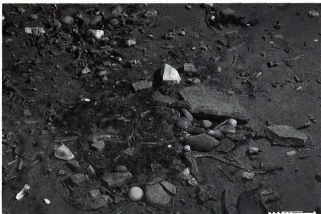
Abb. 2. Neuchâtel NE-Monruz. Magdalénienzeitliches Jägerlager, Feuerstelle.