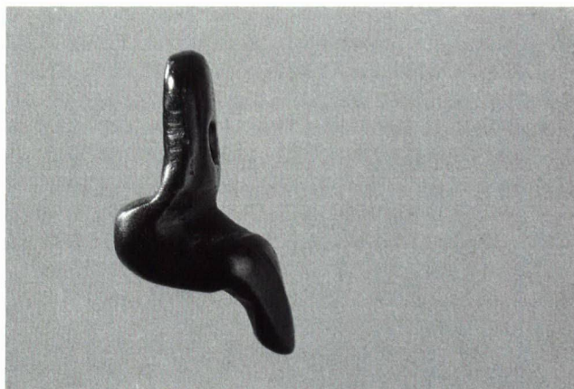
Abb. 4. Neuchâtel NE-Monruz. Magdalénienzeitliches Jägerlager, stark stilisierte Frauenfigürchen aus Gagat. Höhe 1,5 cm.