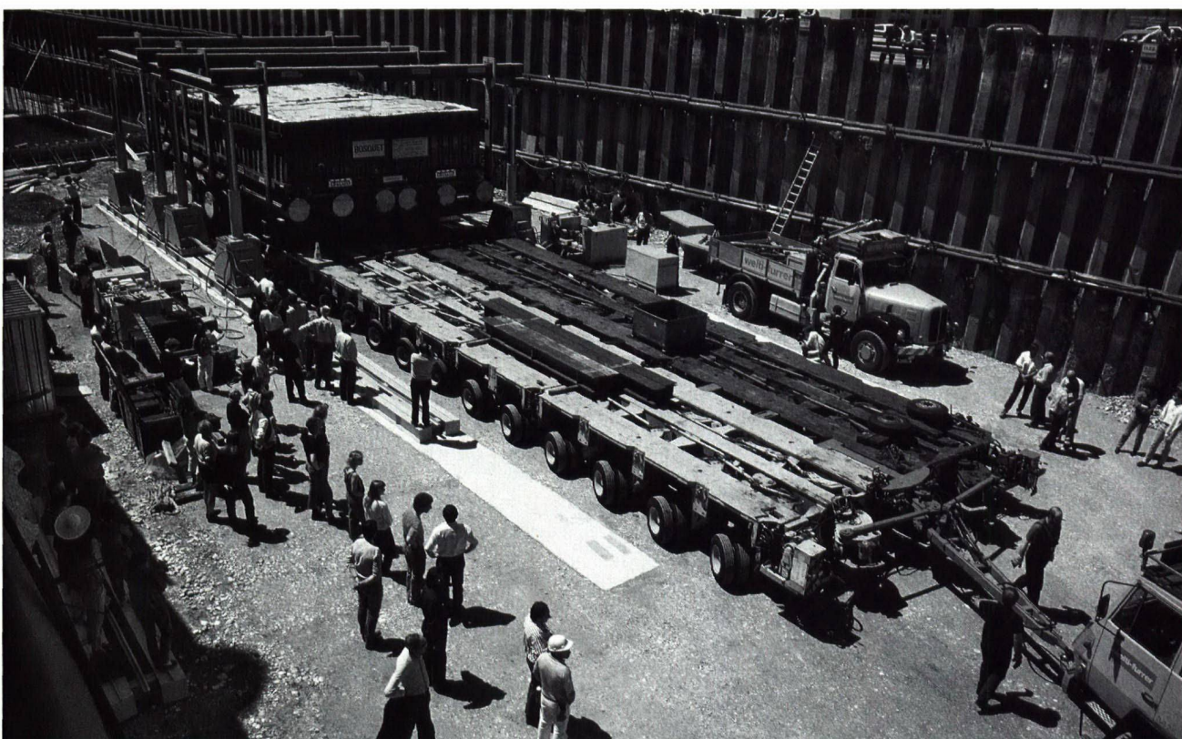
Abb. 3. Neuchâtel NE-Monruz. Abtransport eines im Block geborgenen Teils des magdalénienzeitliches Jägerlagers.