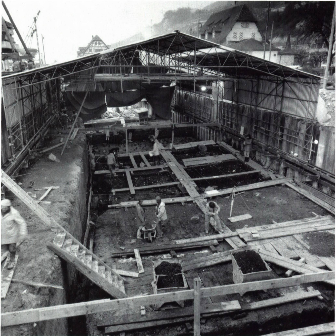
Abb. 5. Twann BE. Ausgrabung in der jungsteinzeitlichen Siedlungssequenz am Nordufer des Bielersees, die beim Bau der Autobahn dokumentiert wurde.