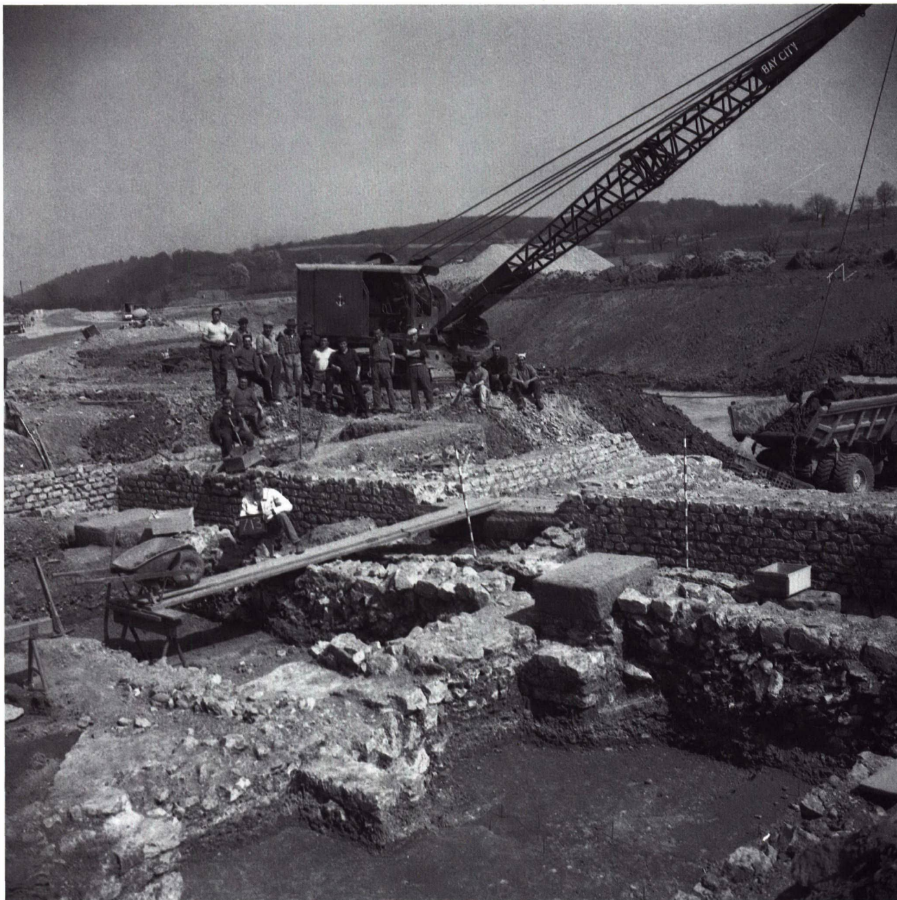
Abb. 6. Augst BL. Ausgrabung im Vorfeld des A2-Baus. Unter extremem Zeitdruck wurden Teile der südlichen Vorstadt Augusta Rauricas untersucht. Nach Ur-Schweiz 1967, 37, Abb. 29.