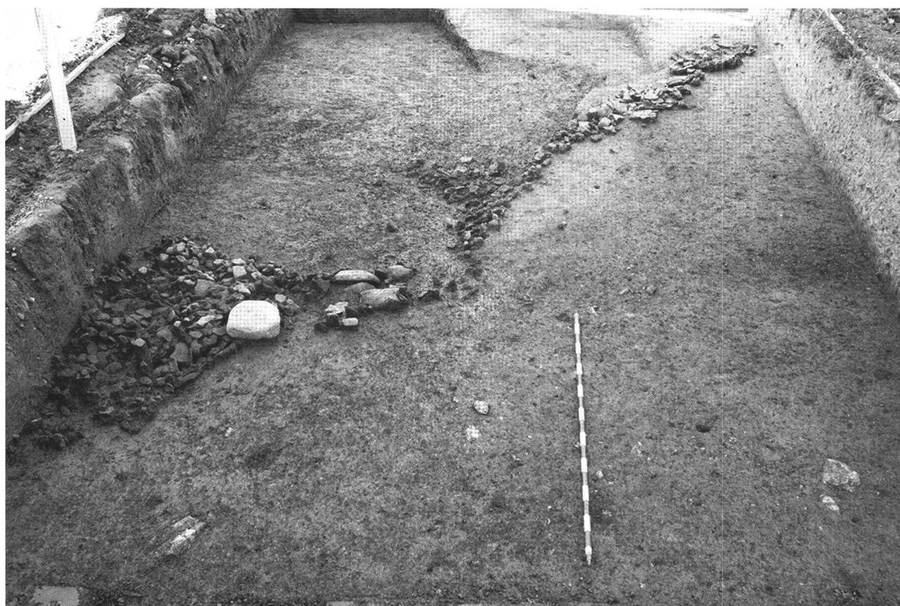
Fig. 2. Le Mormont (VD, Suisse). Les restes de la paroi effondrée. On remarque dans la partie gauche le pourtour circulaire d'une fosse laténienne qui a perturbé le niveau hallstattien.

alors que les deux avant-bras sont croisés sous une pierre en fond de sépulture. L'avant-bras gauche se distingue par l'absence de l'ulna alors que les autres os sont en connexion stricte. On retrouve donc dans ce dépôt les observations mentionnées lors de la fouille des inhumés assis du site d'Acy-Romance (Ardennes, France), à savoir des absences d'os qui s'opposent à l'observation de connexions labiles parfaitement conservées (Lambot/Ménier 2000).