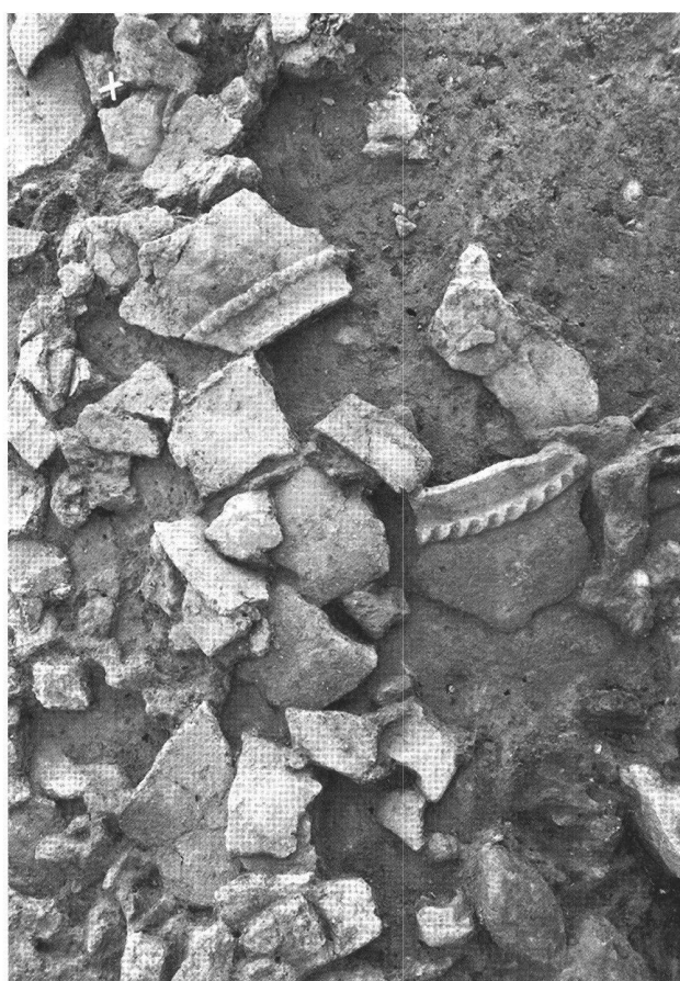
Fig. 3. Le Mormont (VD, Suisse). Détail des céramiques dans le niveau de démolition hallstattien.

L'anomalie 422 comportait deux ensembles distincts. Le niveau supérieur renfermait un corps en décubitus dorsal, associé à des restes de chevaux. Trente centimètres plus bas, trois nouveaux corps ont été déposés sur des restes d'animaux, deux adultes placés côte à côte en décubitus ventral et un enfant en décubitus dorsal (fig. 4). Les deux sujets adultes ne sont représentés que par le tronc et les membres du côté gauche. Les fémurs ont été cassés au milieu des diaphyses. Les avant-bras ont également été brisés aux extrémités distales. Il s'agit bien d'un dépôt de deux corps incomplets en connexion. Ces trois corps présentent des traces