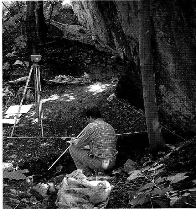
Fig. 7. Salgesch VS, Mörderstein. Vue des sondages en cours de fouille sur le flanc nord du rocher.

Faunistisches Material: wenig, unbearbeitet.