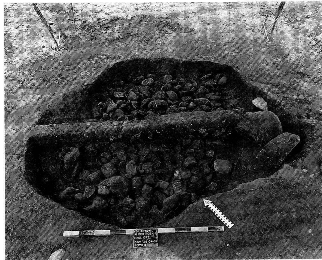
Abb. 9. Volketswil ZH, In der Höh. Brandgrube mit Hitzesteinen, frühe Spätbronzezeit (Bz D).

Datierung: archäologisch. Vermutlich Mittelbronzezeit. KA ZG, J. Weiss.