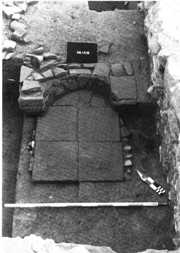
Fig. 4. Avenches VD, Aux Conches-Dessous: Insula 12: Foyer de cuisine en dalles de terre cuite avec les restes de la paroi semi-circulaire de sa cheminée. Première moitié du 1er siècle apr. J.-C.

du moins, une correction de 5° vers le nord du plan des nouvelles constructions.