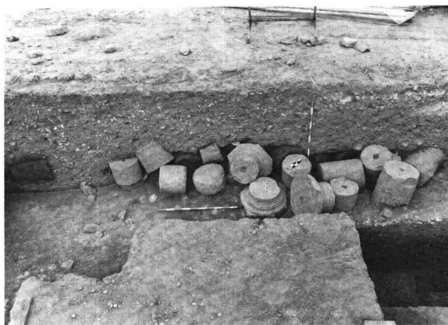
Fig. 5. Avenches VD, Aux Conches-Dessous: Insula 12: Eléments provenant de la colonnade en molasse d'un péristyle et qui ont été déposés en vrac sur le sol d'une cour voisine de la domus. Milieu du 1er siècle apr. J.-C.

nombreuses poussières de bronze retrouvées. Seule a été conservée l'infrastructure de trois fours disposés en batterie avec double paroi de tegulae posées de chant et des ouvertures pour des imbrices faisant office de canaux