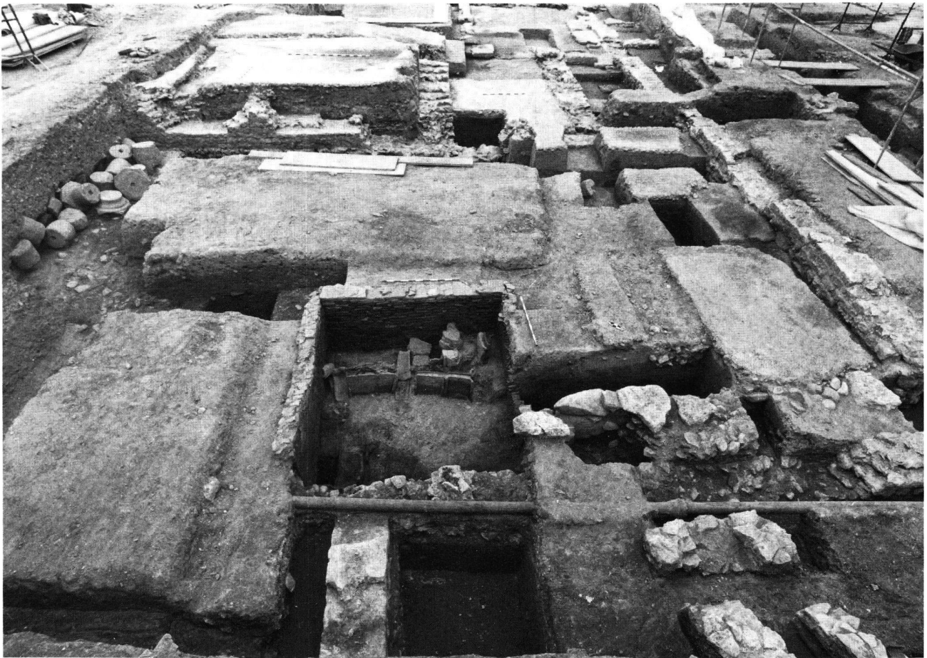
Fig. 2. Avenches VD, Aux Conches-Dessous: Insula 12: Vue d'ensemble des fouilles d'une domus; au premier plan, les fours métallurgiques installés dans les quartiers d'habitation vers le milieu du 3 e siècle apr. J.-C.

castrer dans les soubassements maçonnés. De nombreux fragments et plaques d'enduit mural peint, striés au revers et qui décoraient ces parois, ont été retrouvés dans les couches de démolition de cet état.