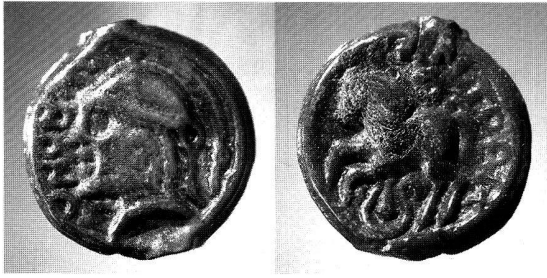
Abb. 18. Reinach BL-Mausackerweg. Gegossene Potinmünze vom Touronos-Cantorix-Typ. M 2:1.