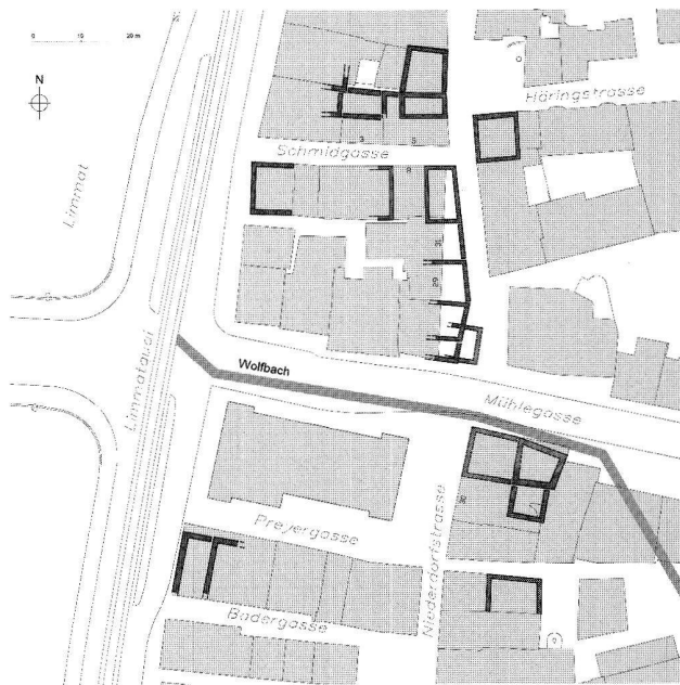
Abb. 1. Zürich, Quartierplan Niederdorf (Ausschnitt). Die ältesten Steinbauten sind dunkel schraffiert. Illustration Stadtarchäologie Zürich.

Haus «Schwandegg» liegt unweit des rechten Limmatufers, 60 m nördlich der Mündung des Wolfbaches (Abb. 1). Der Umbau des Jahres 2000 umfasste u. a. eine teilweise Unterkellerung, die eine Ausgrabung auf einer Fläche von 45 m 2 in den Kellern 1–3 auslöste (Abb. 2).