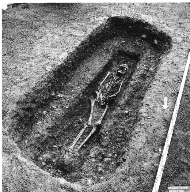
Abb. 13. Bern BE, Engehalbinsel, Reichenbachstrasse 87. Grab 32. Die Tote ist in einem Sarg bestattet worden, der sich von der grösseren Grabgrube deutlich absetzt.

Die Sondierungen im Oktober 1998 im Bereich der Bauparzelle an der Reichenbachstrasse 87 auf der Engehalbinsel bei Bern haben gezeigt, dass im südöstlichen Teil der geplanten Überbauung mit Gräbern zu rechnen war. Die Rettungsgrabung wurde in der ersten Hälfte 1999 in mehreren, den Baufortschritt berücksichtigenden Etappen durchgeführt. Nach dem maschinellen Abtrag der Deckschichten zeichneten sich die Grabgruben auf der Kiesoberfläche in der Regel deutlich ab. Einer einzigen Brandbestattung stehen 36 Körpergräber gegenüber, wobei die Skelette sehr unterschiedlich gut erhalten sind. Falls überhaupt erkennbar, waren die Toten in gestreckter Rückenlage beigesetzt worden. In wenigen Fällen zeigen sich Sargspuren (Abb. 13). 24 Individuen wurden bereits auf der Grabung selbst provisorisch anthropologisch bestimmt (D. Rüttimann). Aufgrund der Resultate und der Grabgrubengrösse unterscheiden wir 17 Erwachsenen- und 19 Kindergräber. Bei den neun bereits geschlechtsbestimmten Erwachsenen handelt es sich ausnahmslos um Frauen. Bei den Beigaben fallen folgende Punkte auf: In 19 Gräbern ist