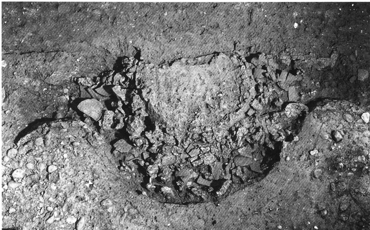
Abb. 12. Basel BS-Gasfabrik. Spätlatènezeitlicher Töpferofen mit zweiseitiger Einfuerung. Nach Ausweis der Funde aus der Heizkanalverfüllung wurde darin Feinkeramik und wahrscheinlich auch bemalte Ware gebrannt.