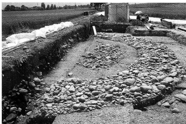
Abb. 7. Concise VD, Fin de Lance. Structure funéraire circulaire, avec fossé interne et externe.

Dans une séquence limoneuse surmontant la molasse, de nombreux tessons de céramique appartenant au Hallstatt ancien ont été découverts. Ils proviennent d'un habitat dont la fouille est en cours.