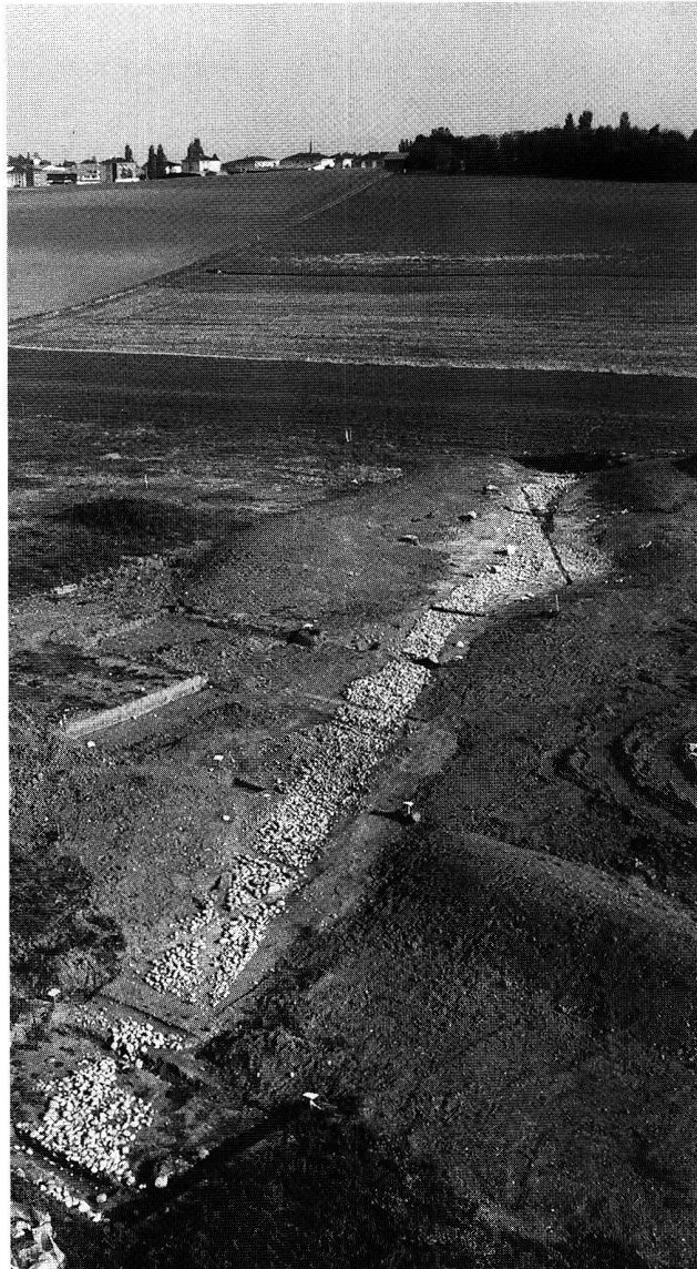
Fig. 4. Cortaillod NE, Petit Ruz. Vue générale de la route, qui se poursuit au-delà de la limite de la fouille.

Dans le cadre d'une première campagne de fouille – projet de l'Association pour la Sauvegarde du Patrimoine de Fully avec le soutien financier de l'ORA VS, de la Commune de Fully et de fonds privés –, 15 sondages de surface restreinte ont été entrepris. Ils ont permis de mettre au jour des structures liées à un habitat (empierrement, fosse, trou de poteau, ...) autour du plateau sommital de l'éperon dont la surface protégée couvre environ 2 hectares. Pour ce qui est des aménagements défensifs au nord de