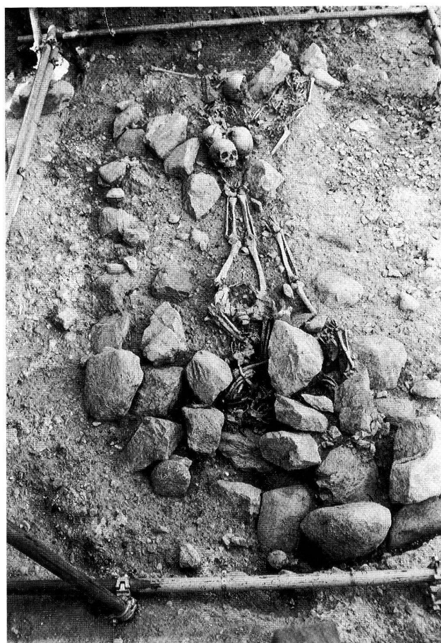
Fig. 6. Vue générale de la structure 4.A. Au premier plan, deux corps en connexion partiellement recouverts de blocs et au fond, les crânes correspondant aux inhumations précédentes.