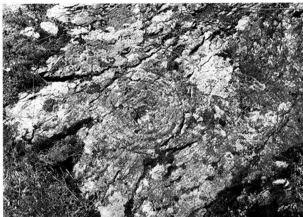
Abb. 5. Tinizong-Senslas GR; Felszeichnungen mit Schälchenmotiv und konzentrischen Kreisen.