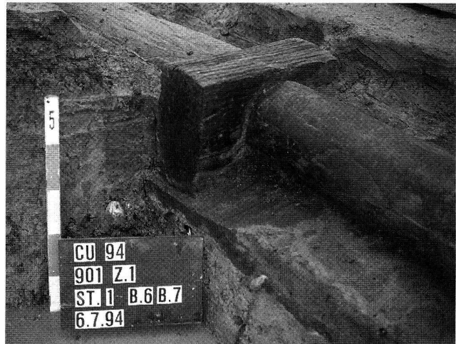
Fig. 10. Pomy-Cuarny VD, La Maule. Canalisation gallo-romaine en bois du début du 2e s. ap. J.-C.

Sion VS, Colline de Tourbillon voir Néolithique